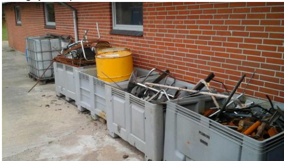
Opbevaring af alm. jern

Virksomheden har indkøbt en spildbakke, hvorpå bl.a. olieprodukter til maskinerne skal placeres.