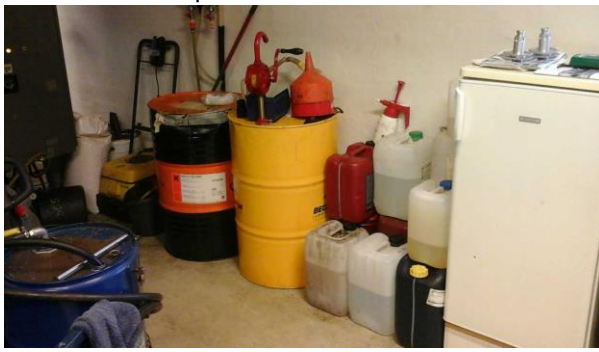
Spildbakke til olieprodukterne er indkøbt

Virksomheden har indkøbt en spildbakke, hvorpå bl.a. olieprodukter til maskinerne skal placeres.