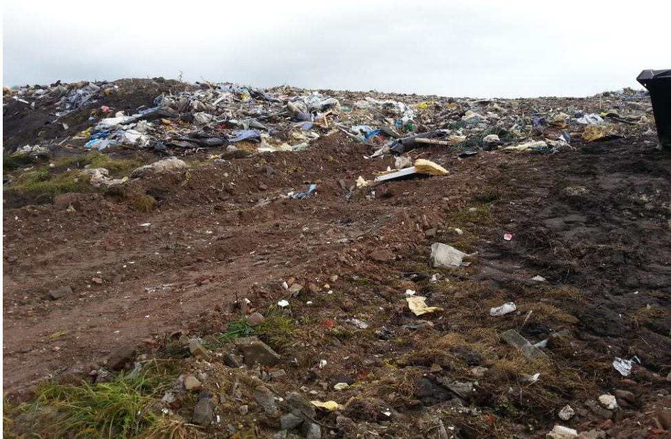
Celle 2.2.1. Blandet affald

Der blev ved tilsynet ikke konstateret affaldstyper, som ikke må deponeres på deponiet.