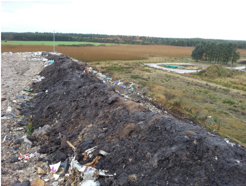
Celle 2.2.2 set fra celle 2.2.1

PCB cellen var ved tilsynet nedlagt, som følge af manglende leverancer af PCB holdigt byggeaffald. Cellen etableres på ny, når der igen modtages asbestholdigt affald i Deponi Syd.