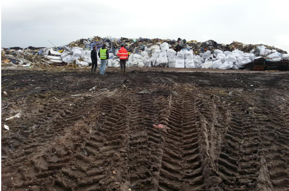
Celle 2.2.1. Asbestecelle