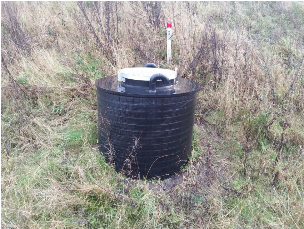
Ny perkolat gennemløbsbrønd 2