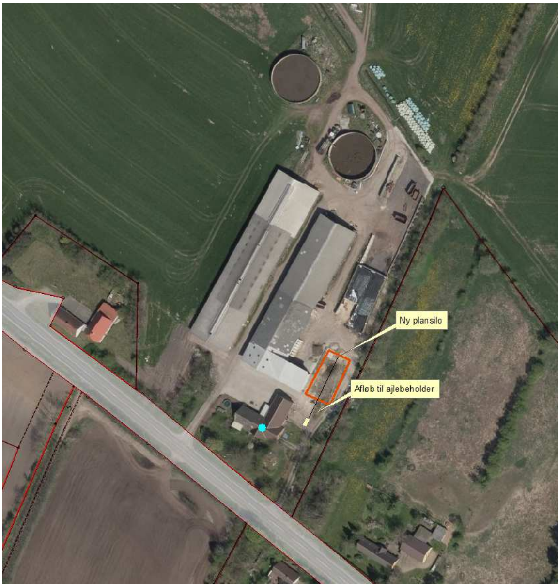
Kort 1: Placering af den nye plansilo på Toftlundvej 31 såvel som afløb.

Placeringen af det ansøgte i forhold til bedriftens eksisterende bygninger fremgår af kort 1.