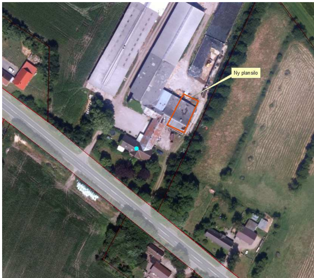
Kort 2: Placering af den nye plansilo på Toftlundvej 31 i forhold til eksisterende randbeplantninger og øvrige afskærmende forhold i form af bygninger, mm. Luftfotoet er optaget i 2014 og viser bygninger, hvor plansiloen ønskes etableret, som siden er fjernet.

På den baggrund, og fordi der er tilstrækkelig med beplantning rundt om gårdanlægget, og i matrikelskel i øvrigt, vurderer Esbjerg Kommune at udbygningen af gårdanlægget med en ny plansilo ikke påvirker det stedlige landskab i væsentlig grad. Kravet om afskærmende beplantning fraviges derfor, jf. godkendelsesbekendtgørelsens §38, stk. 5.