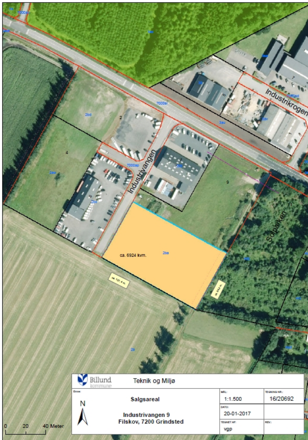
Figur 2: Placering af pladsen, målestok er ikke gældende.