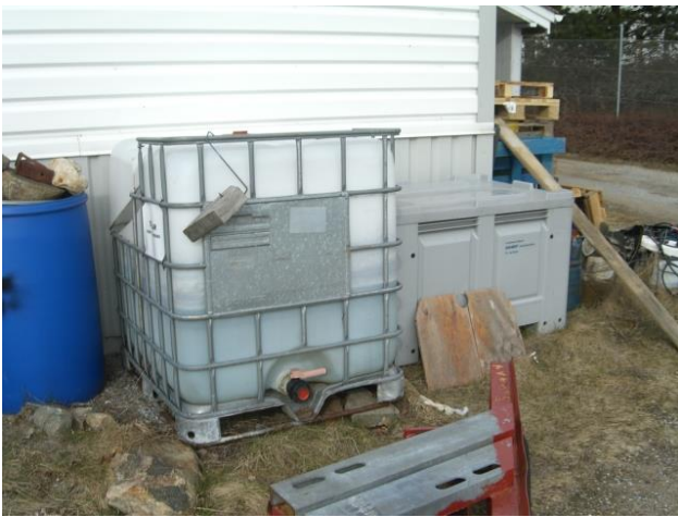
Balje til afprøvning af bådmotorer