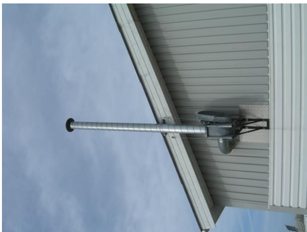
Afkast fra udstødning