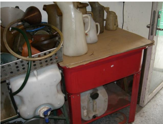
Rensebar på betongulv indendørs