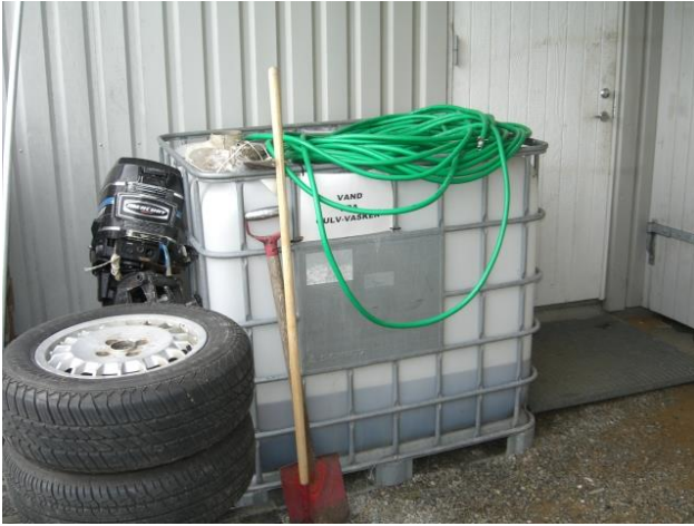
Vaskevand fra gulvasker