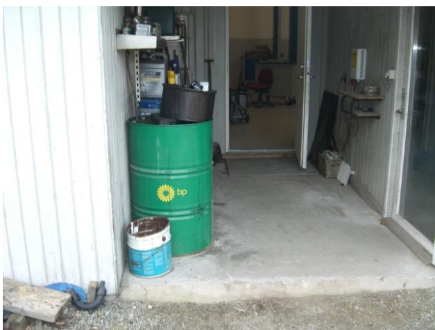
Spildolietønde til afdrypning af oliefiltere. NB er ændret til dunk med spildbække