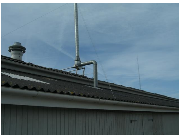
Afkast fra udstødning