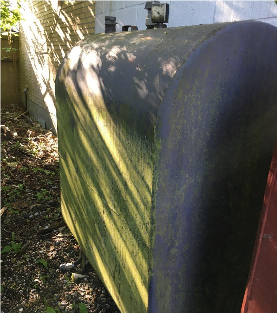
Gammel olietank der er aftalt fjernet fra ejendommen.