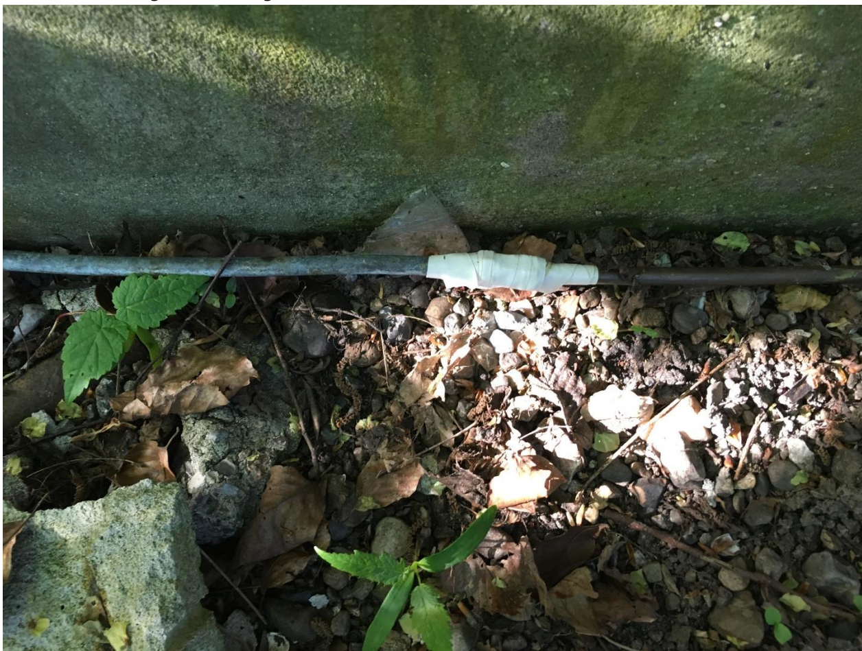
Rørføring til tank med tapesamling.

det var ikke muligt at se om installationen utæt eller om den er udført korrekt i henhold til olietankbekendtgørelsens regler.