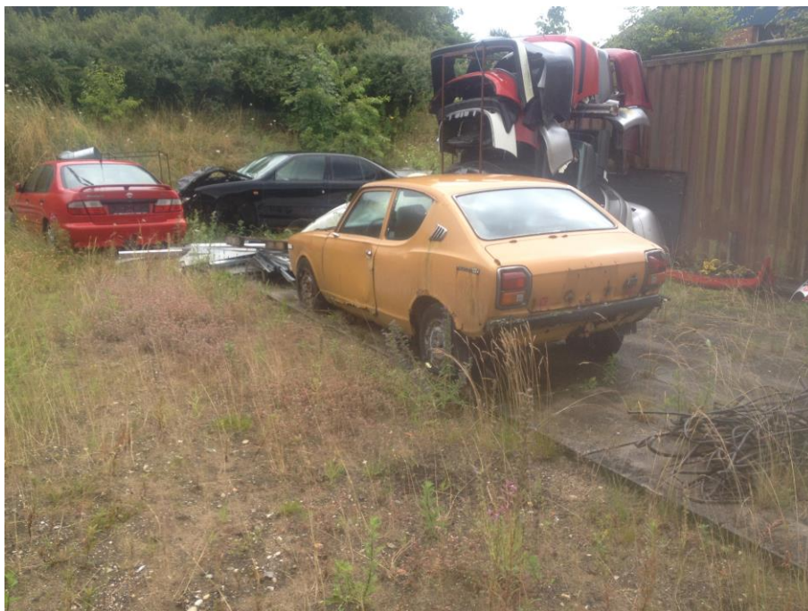
Billede 4. Rød Nissan skal istandsættes (bil nr. 2), sort bil skal istandsættes (bil nr. 3), gul Datun 100 (bil nr. 4) skal istandsættes