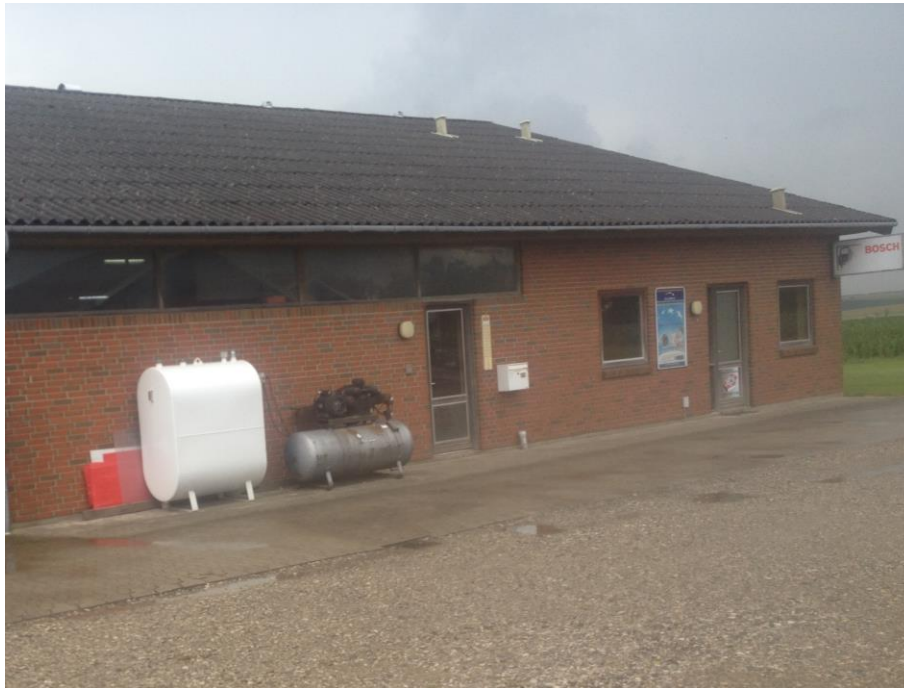
Billede 2. Billede af olietank fra 2011 samt af generator.