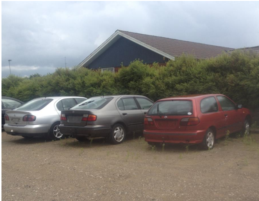
Billede 5. Sølvfarvet nissan (bil 5) skal istandsættes, koksgrå nissan (bil 6) skal istandsættes, rød nissan (bil 7) skal istandsættes.

Norrdjurs Kommune indskærpede ved tilsynet, at biler der ikke er indregistrerede og som ikke umiddelbart kan synes skal laves i stand. Dette skal ske indenfor 6 måneder. Bilen skal straks herefter kunne synes. Hvis dette ikke er tilfældet skal den afleveres til godkendt modtager. Det blev bemærket, at bil nr. 2, 3, 4 og 7 blev også observeret ved sidste tilsyn i 2014.