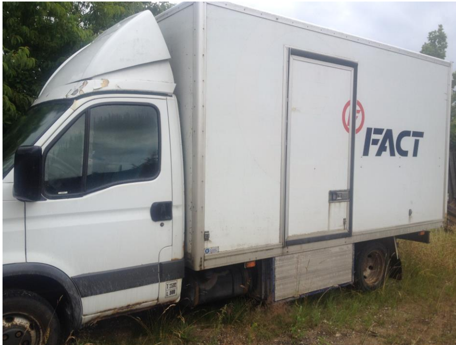
Billede 3. Bilen skal sælges (bil nr. 1)