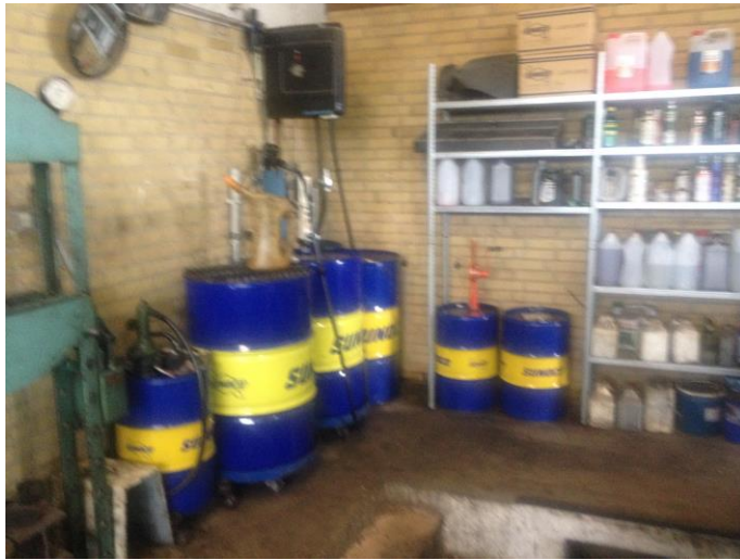
Billede 1. Opbevaring af kemikalier