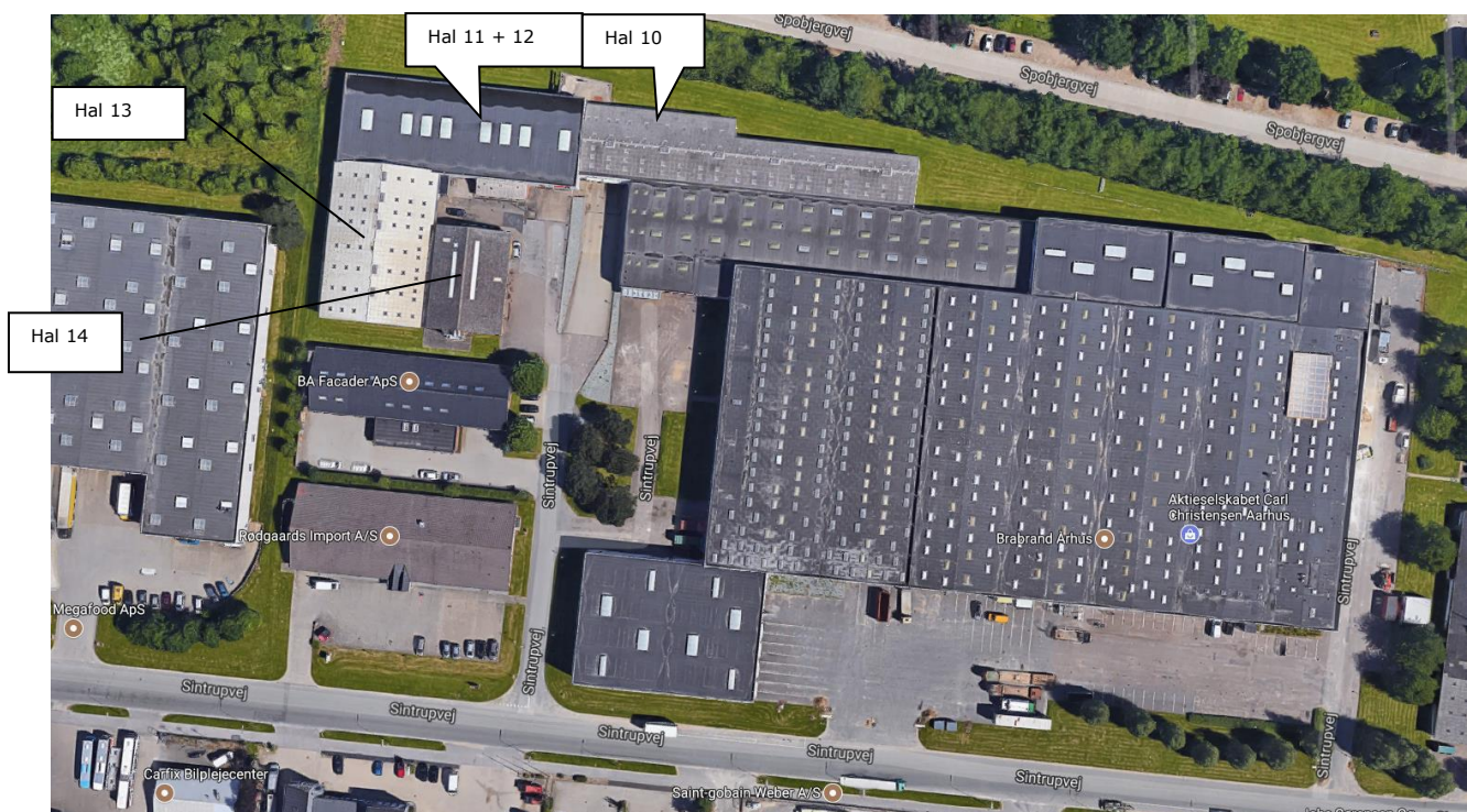
Luftfoto af virksomheden og herunder hal 10 - 14 til oplag af olie og kemikalier

Virksomheden ligger i område 240102ER i henhold til kommuneplanen, der er udlagt til erhvervsformål. Nord for virksomheden ligger Skjoldhøjkollegiet og nordvest for virksomheden ligger et område med kolonihaver.