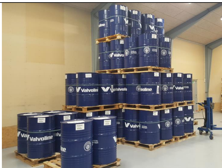
Fig. 2 Oplag af olier i tromler