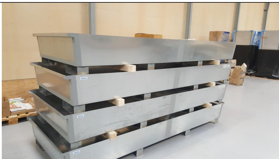
Fig. 3 Opsamlingsbakker til placering under pallettanke

Virksomhedens olier og kemikalier opbevares indendørs på betongulv uden afløb. Der foregår ikke udendørs håndtering eller oplag, da alle produkter leveres via læsseramper. Der foregår ikke omhældning af olier eller kemikalier. Alle fuger i gulvet er kradsat op og fornyet, og der er etableret riste med opsamlingsbassin ved døre og porte. Alle palletanke vil snarest blive placeret på nye opsamlingsbakker, der kan rumme 1.000 liter – se fig. 3.