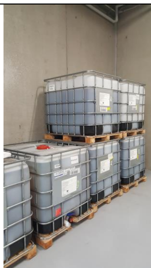
Fig. 1 Oplag af olier i palletank

En del af del planlagte olieoplag på op til 500 m 3 er allerede etableret i form af oplag af tromler og palletanke som det fremgår af fig. 1 og 2. Oplaget af kemikalier, der er farlige for vandmiljøet, er endnu ikke etableret.