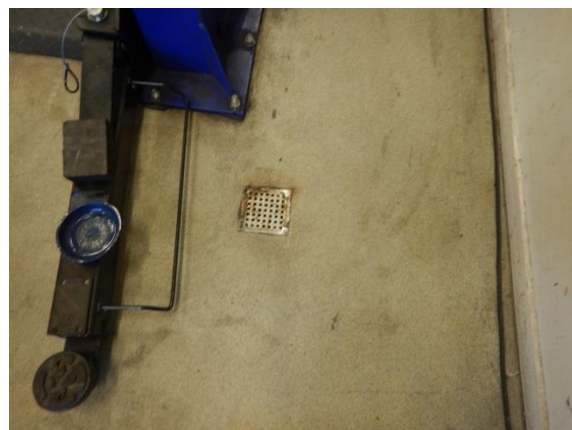
2. Afløb i værksted.