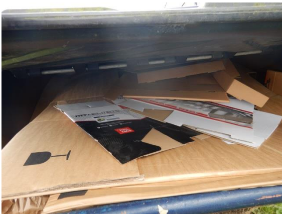
5. Container til papaffald.