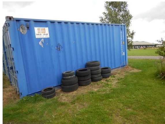
6. Brugte dæk.