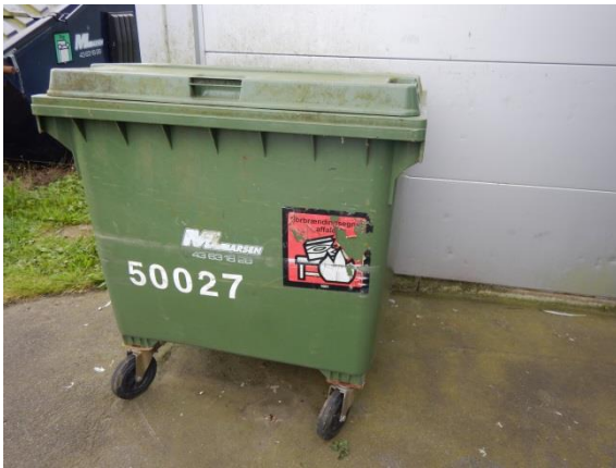
3. Container til brændbart affald.