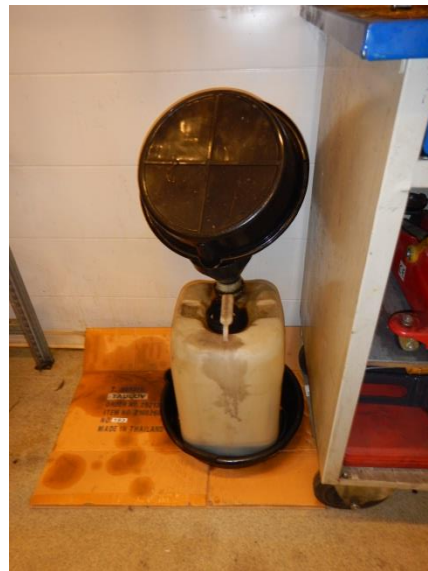
4. Dunk til spildolie i spildbakke.