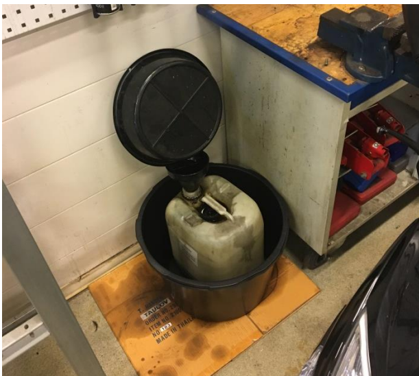
7. Eftersendt billede med ny spildbakke.