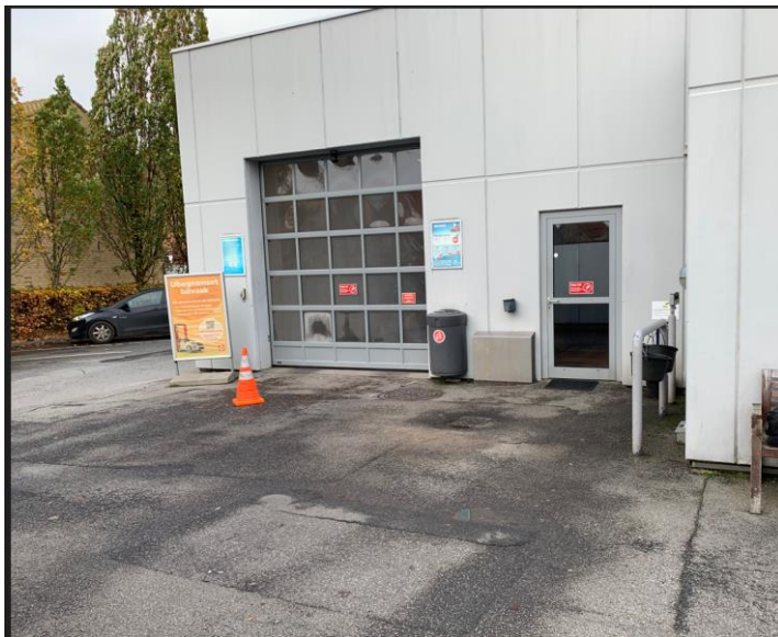
Foto af vejrist ved forvaskepladsen

Der skal derfor hældes farvet vand eller lignende i afløbsristen for at dokumentere, at afløbet er ført til spildevandssystemet.