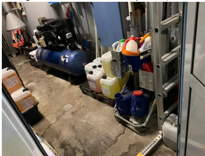
Foto af kemikalierum

Betongulv i kemikalierum skal repareres, så der ikke er revner i gulvet