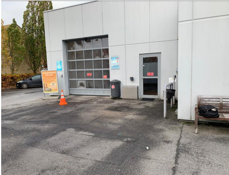
Foto af belægning på forvaskepladsen