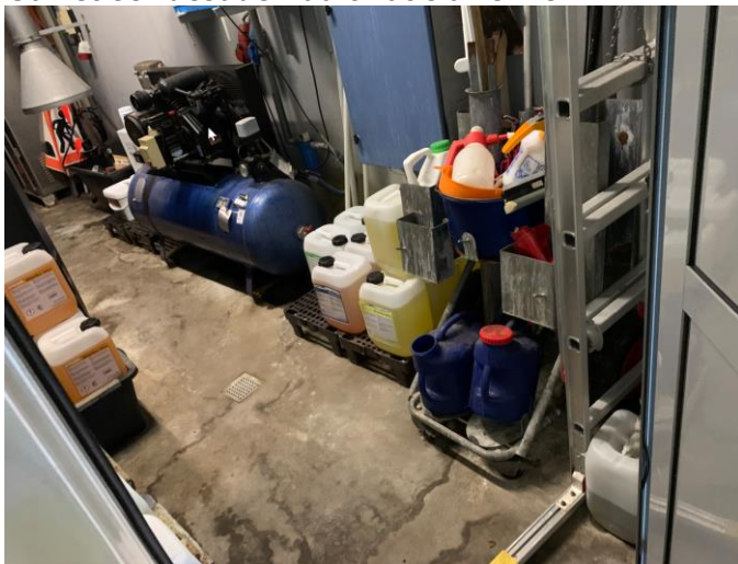
Foto som viser gulv i kemikalierum med afløbsrist og revner i gulvet.

Betongulv i kemikalierum skal repareres, så der ikke er revner i gulvet