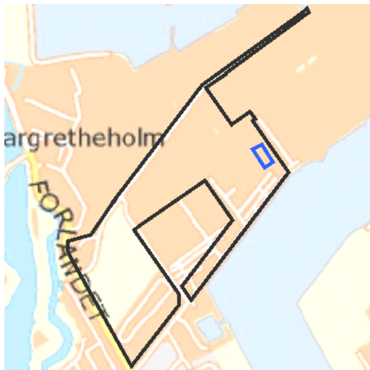
Placering på matrikel