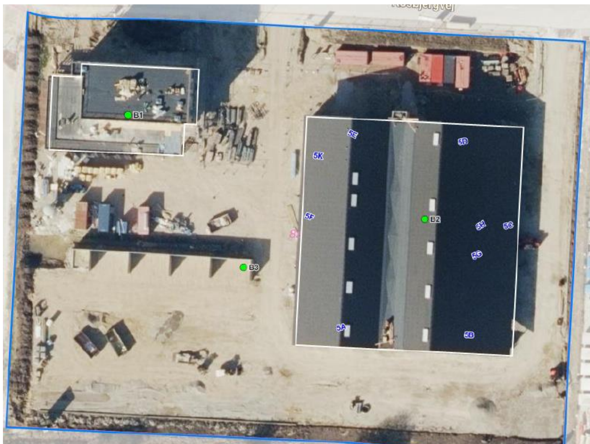
Luftfoto af virksomheden med matrikelskel, anno 2021

I forhold til kommuneplanen ligger virksomheden i område erhvervsområde 240702ER, der er omfattet af lokalplan 812. Der må ikke opføres eller indrettes boliger i området. Nærmeste bolig ligger ca. 75 meter øst for virksomheden.