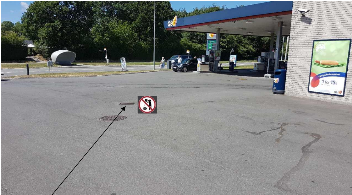
Denne regnvandsbrønd midt på ejendommens indkørselsareal udstyres med piktogram om spildevand ikke må tilledes.