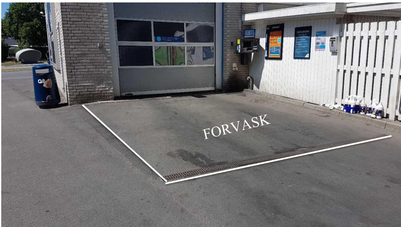
Ny forvaskeplads med afløbsrende til spildevandskloak. Skal afmærkes tydeligere som forvaskeplads som skitseret.