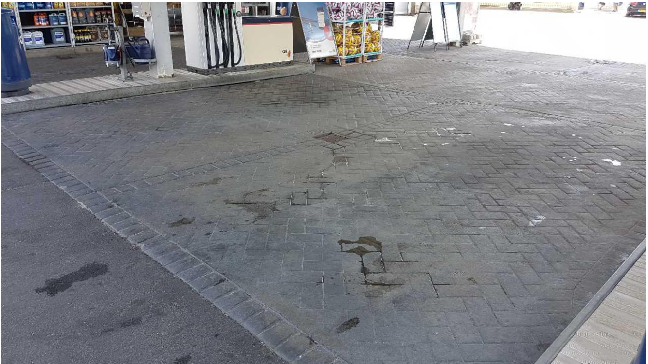
Betonbelægning med konturer på salgspladser.