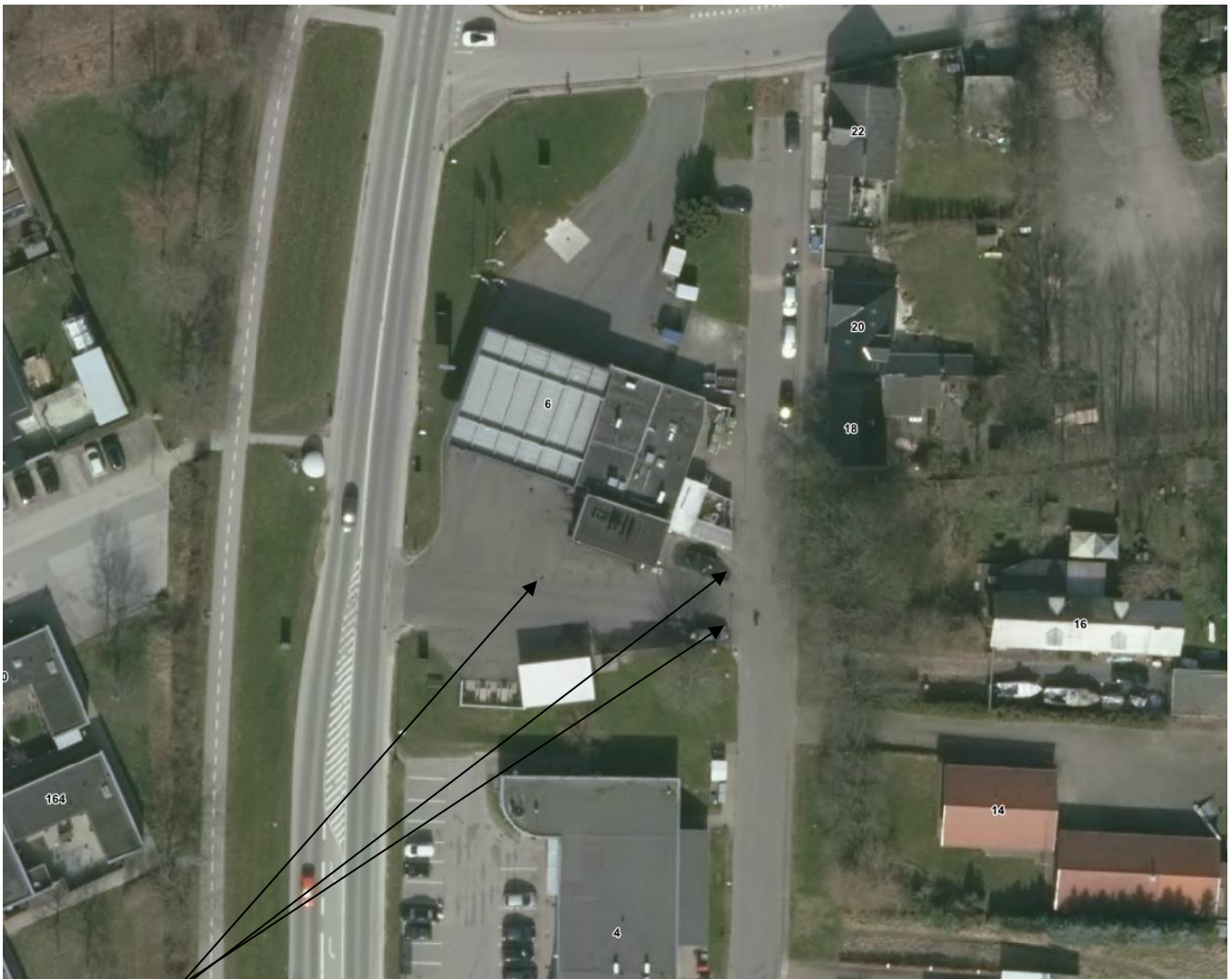
Disse tre regnvandsafløb vil blive markeret med følgende forbudspiktogram: