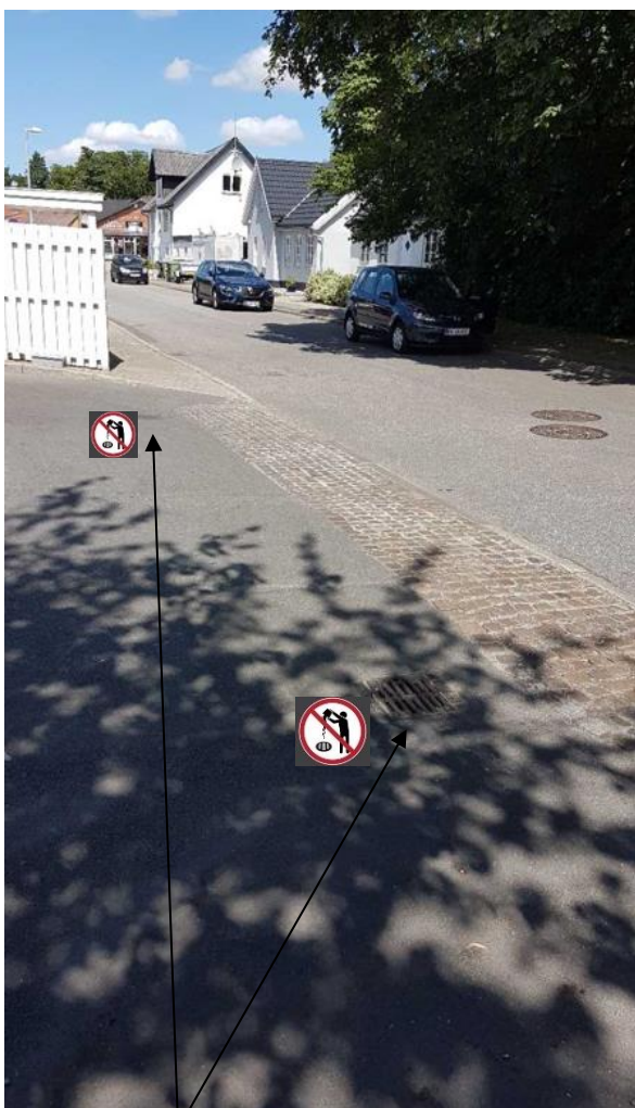
Disse to regnvandsbrønde nedenfor forvaskepladsen udstyres med piktogram om spildevand ikke må tilledes.