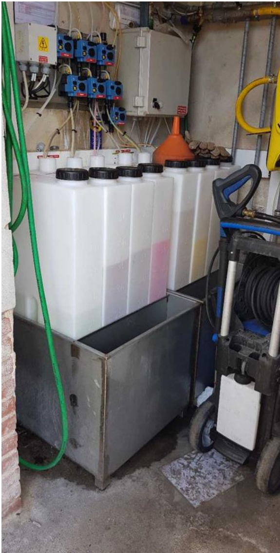
Vaskekemikalier står i dunke over spildsikring i teknikrummet.