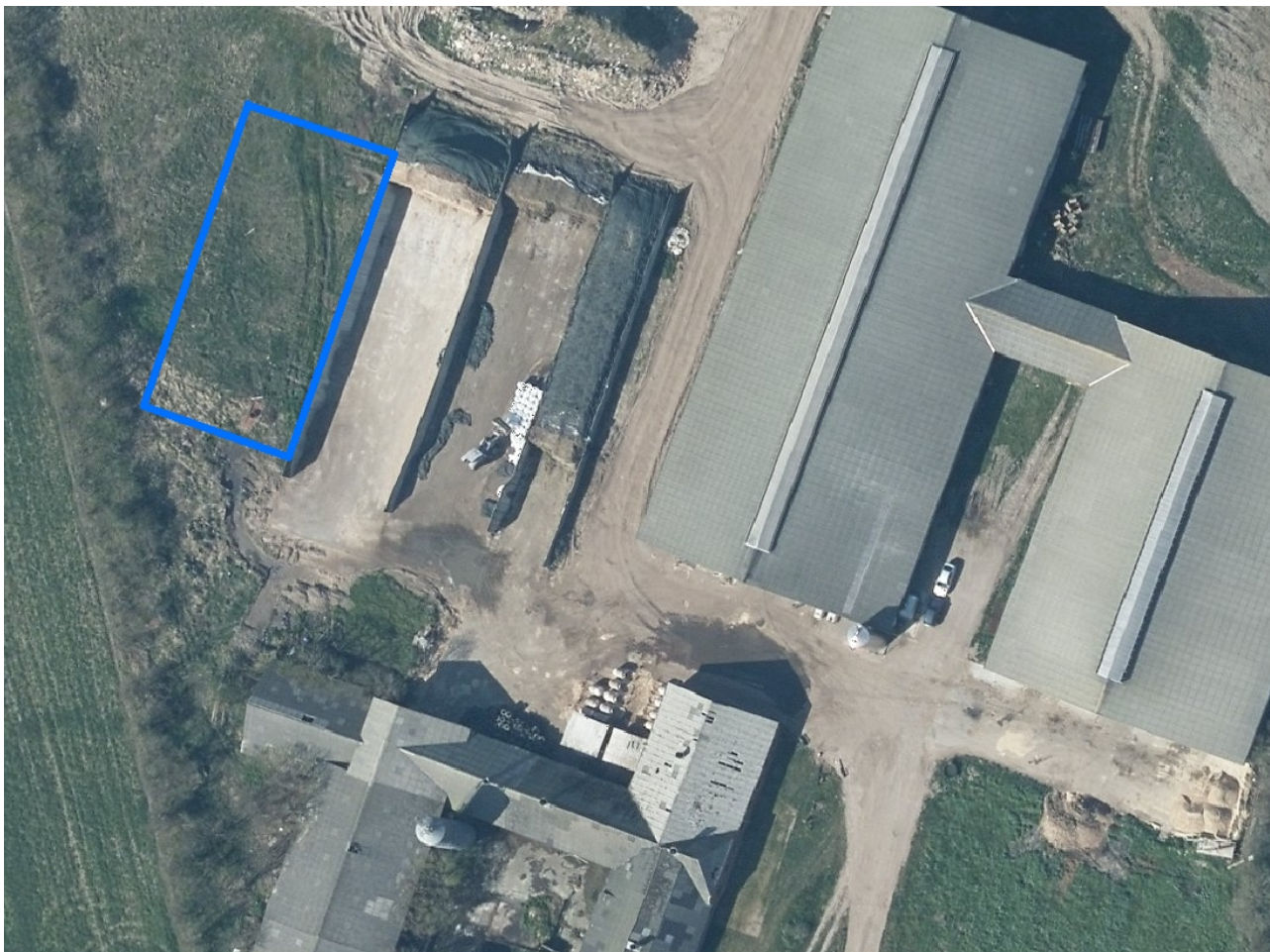
Kort 1: Placering af ensilageplads og eksisterende bygninger

Placeringen af det ansøgte i forhold til bedriftens eksisterende bygninger fremgår af kort 1.