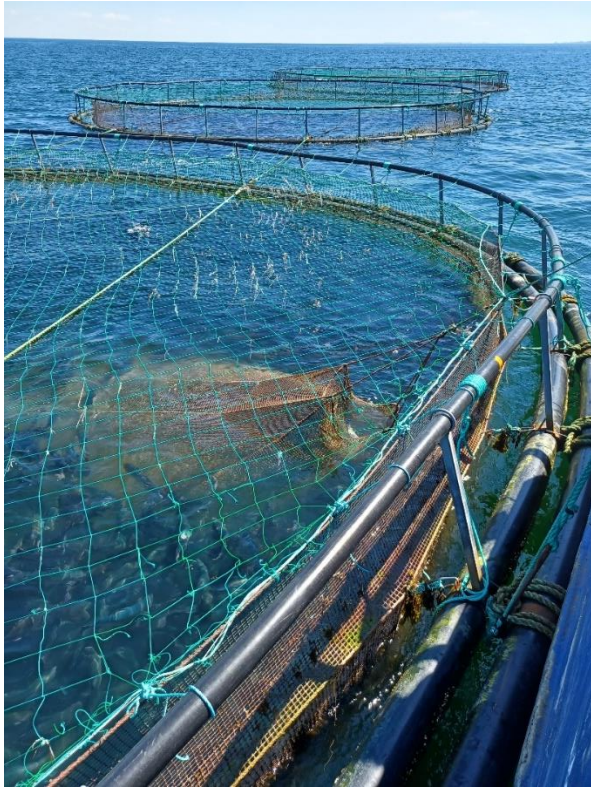
Tømning af dødeposen

De døde fisk fra Rågø, Onsevig, Fejø og Skalø havbrug samles i samme spand/tønne med låg og sendes til forgasning. Dødeposen var blevet tømt tidligere på dagen og indeholdt 1 fisk.