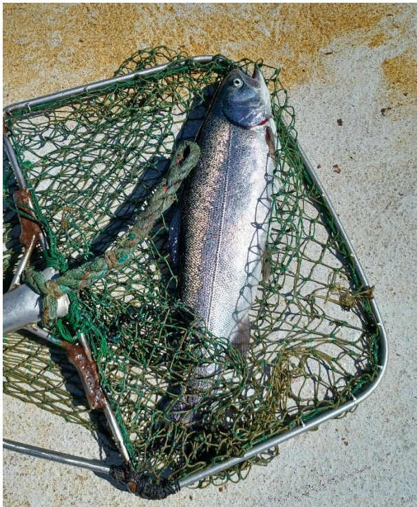
Fisk fra dødeposen

De døde fisk fra Rågø, Onsevig, Fejø og Skalø havbrug samles i samme spand/tønne med låg og sendes til forgasning. Dødeposen var blevet tømt tidligere på dagen og indeholdt 1 fisk.