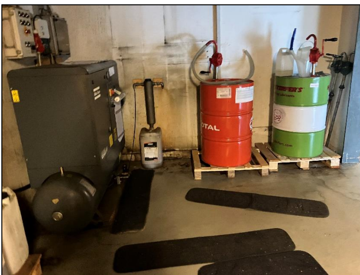
Opbevaring af olie m.v.