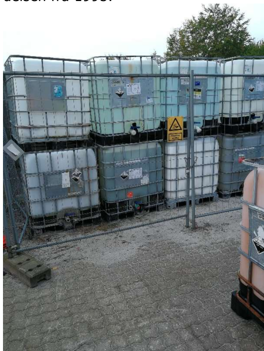
Opbevaring af tanke med 30 % HCL

Råvarer som 30 % HCL opbevares udendørs på sten. Det blev aftalt, at der skal etableres en opsamlingsløsning, der kan tilbageholde indholdet af den største beholder, jf. vilkår 2 i miljøgodkendelsen fra 1995.