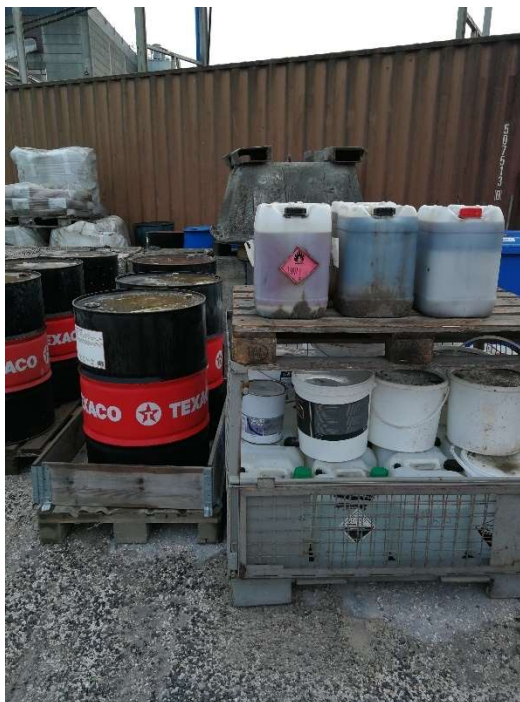
Opbevaring af råvarer/affald.