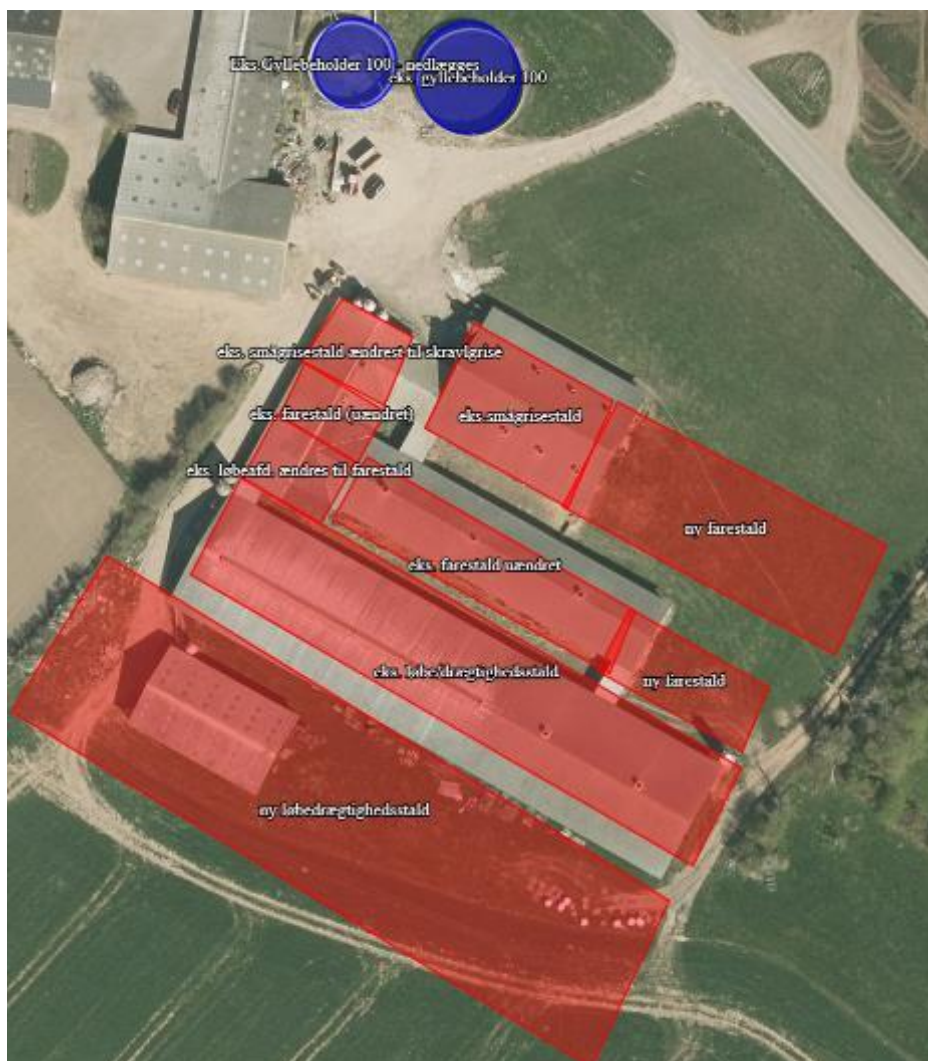
Figur 2. Placering af produktionsarealer.

Med ovenstående forudsætninger har Haderslev Kommune beregnet en ammoniakemission fra Favstrupvej 106, 6100 Haderslev på 4719,0 kg kvælstof pr. år (se tabel 1).