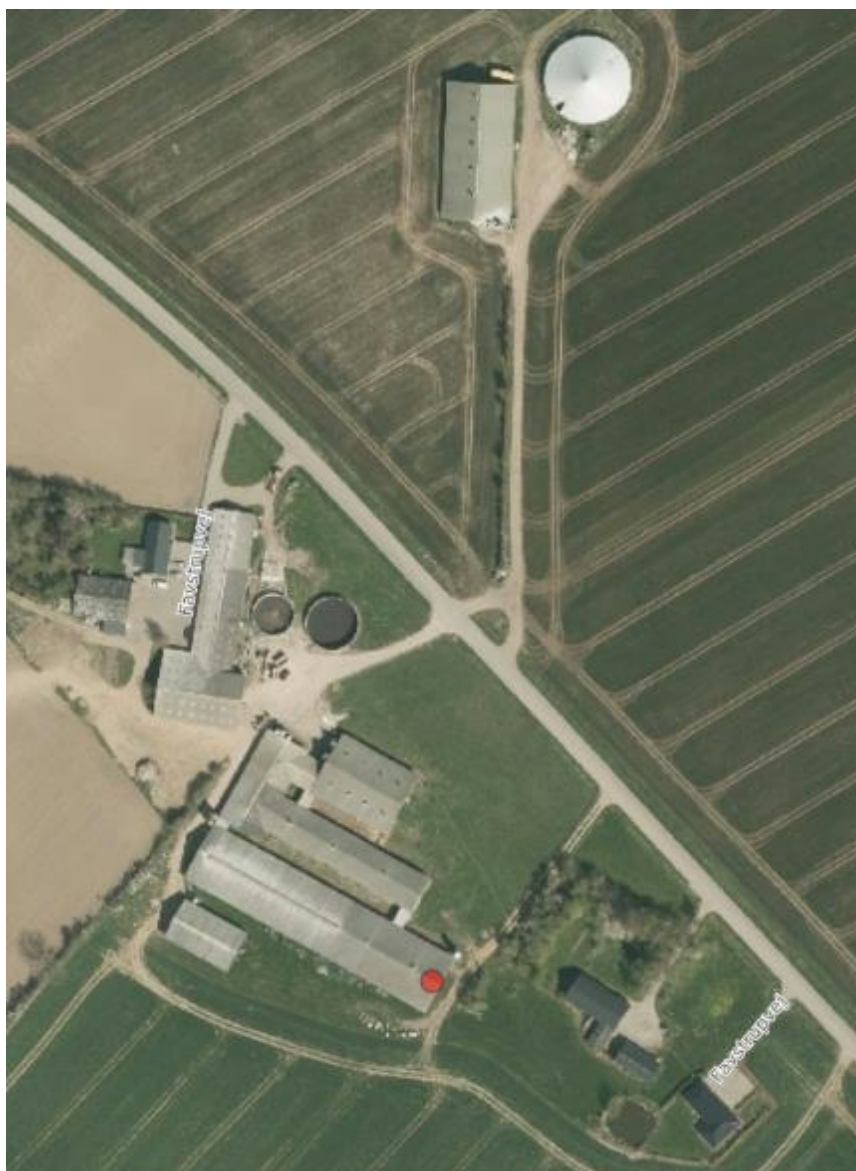
Figur 1. Oversigt over bygninger.

Figur 1 viser oversigt over bygningerne på Favstrupvej 106, 6100 Haderslev. Siden 2012 er der ikke sket ændringer på bygningerne.