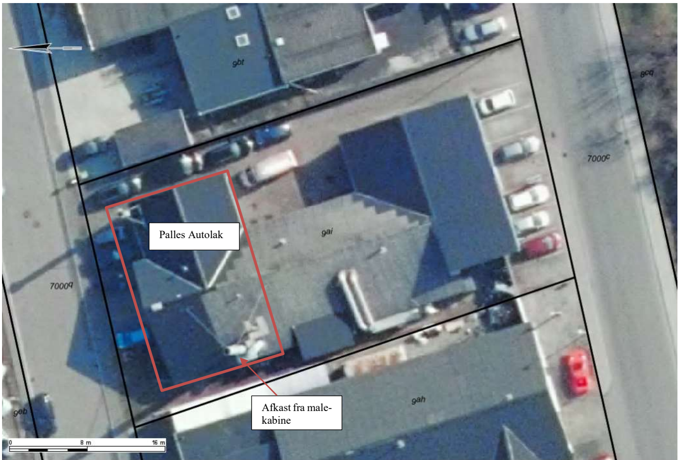
Oversigt over virksomheden