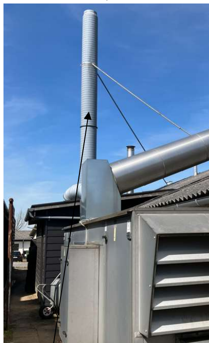
Afkast fra malerkabinen

Klædningsrum opvarmes med fjernvarme. Malerkabinen opvarmes ved et oliefyrt.