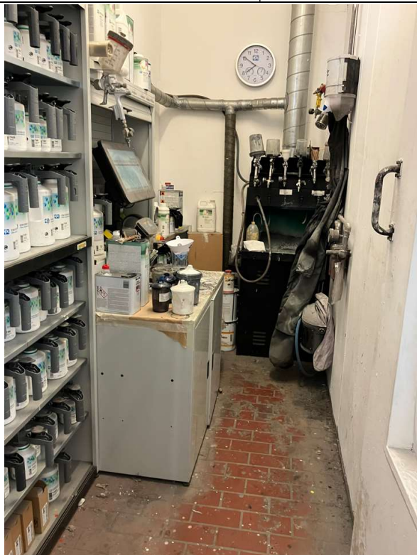
Vandbaseret lak i blanderum