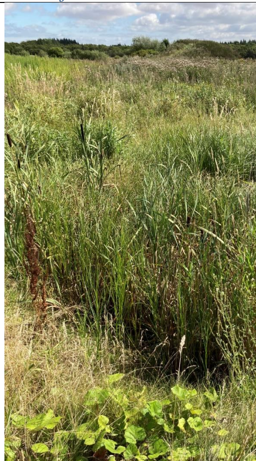
Der vokser dunhammer i lavninger.