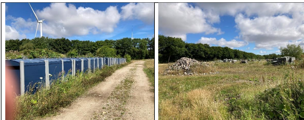
På areal vest for deponi er mindre oplag af materiel.