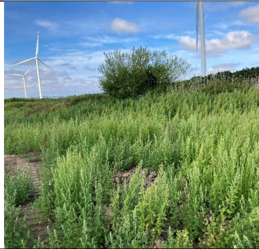
Areal med udlagt jord