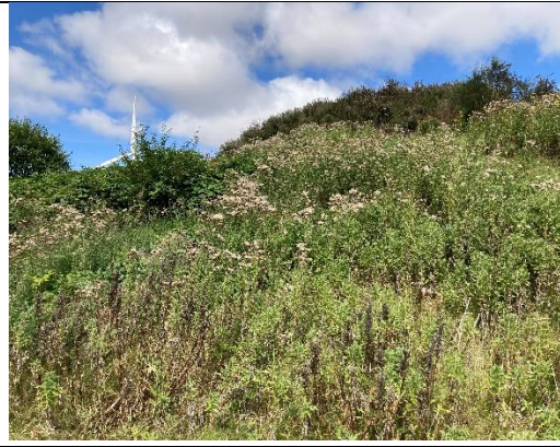
I baggrund ses en høj der ikke er udjævnet.