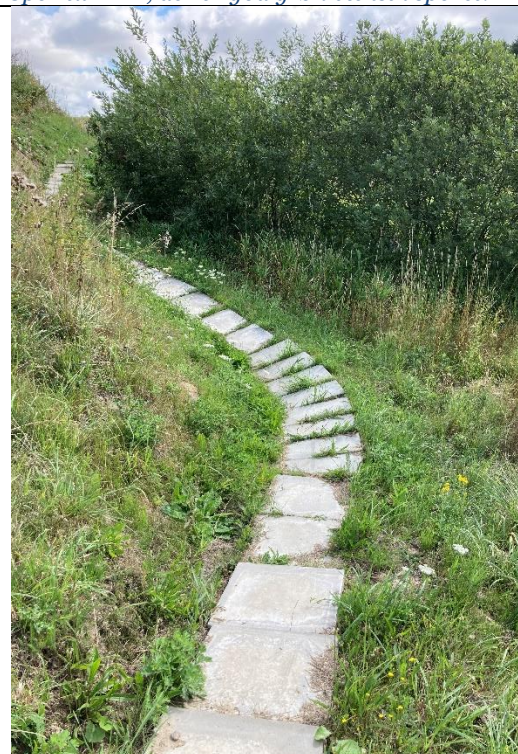
Spor til MTB, hvor der er udlagt fliser..