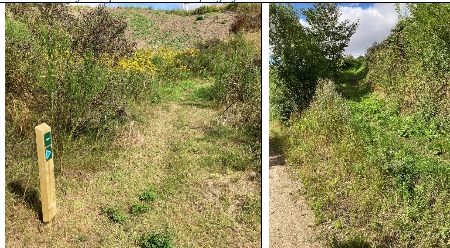
Spor til MTB, der er god grøn vækst i sporet.