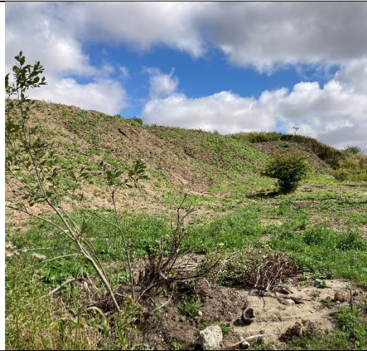
Arealer hvor der r udlagt jord – skråning mod syd.