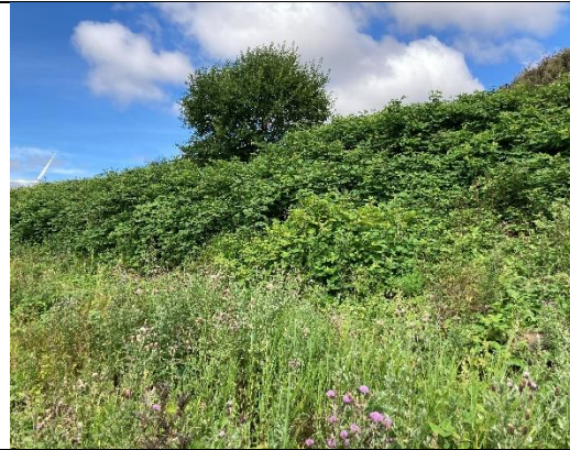
Bevoksning med bl.a. træer. .