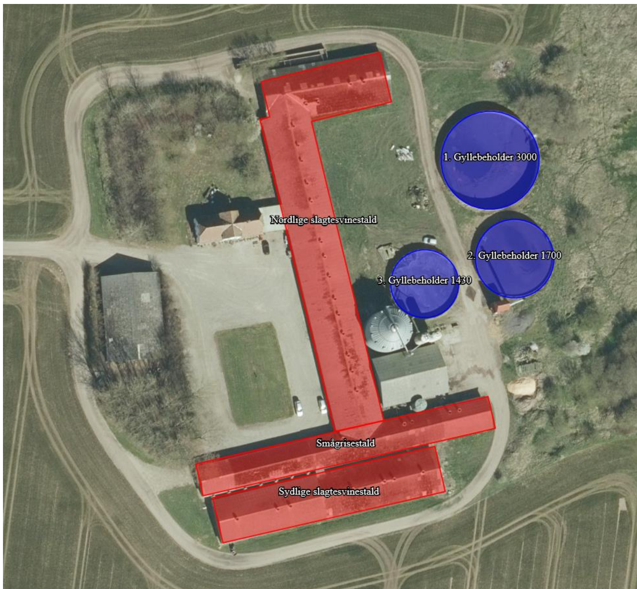
Figur 3. Oversigtskort over produktionsanlæg på Nørremarksvej 6, Jordrup.

IE-husdyrbruget på Nørremarksvej 6, Jordrup påbydes i henhold til § 39, jævnfør § 41 og § 43 a i Husdyrbrug- loven følgende vilkårsændringer i forhold til godkendelsen af den 4. juli 1989 med efterfølgende anmeldelser: