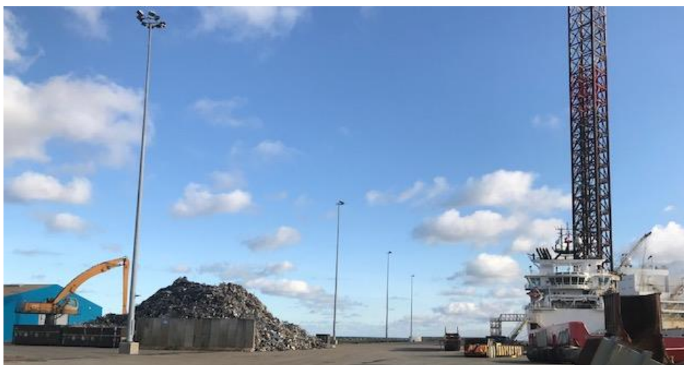
Billede 5. Udskibning af metalskrot på kaj 57.

Ved tilsynet blev der udskibet metalskrot fra kaj 57, se nedenstående billede 5. Ved tilsynet var det uklaret hvilken af kajene der var godkendt til oplag og udskibning, jf. virksomhedens miljøgodkendelse af den 29. april 2016. Ved efterfølgende gennemgang af virksomhedens miljøgodkendelse er det dog bekræftet at kaj 56-57 er godkendt til aktiviteten. Udskibningen af metalskrot fra denne plads er således i overensstemmelse med vilkårene i miljøgodkendelsen.