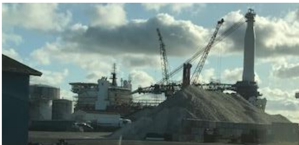
Billede 4. oplag af salt