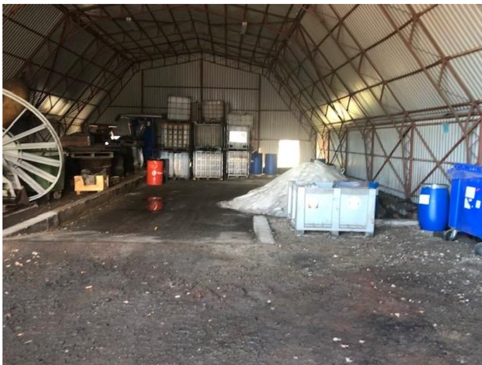
Billede 1. Oplag af affald i den blå telthal samt billede af den tætte grav.

I forbindelse med driften af havnen modtages affald fra skibe. Affaldet sorteres og opbevares i den "Blå telthal" sammen med øvrigt affald, se nedenstående billede 1 og 2. I telthallen findes en tæt grav til oplag af flydende og olieholdigt affald. De forskellige containere er navngivet på dansk i forhold til affaldssortering. Ved tilsynet blev der nævnt, at det ville være en god idé, at der også var et skilt på engelsk eftersom mange af af skibenes besætninger, som afleverer affald ikke taler dansk.