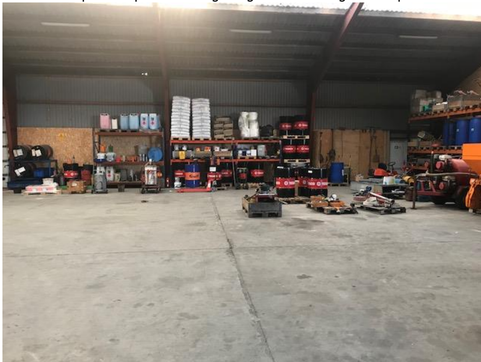
Tabel 3. Billede fra værkstedet. Opbevaringen af kemikalier/råvarer ses i baggrunden.

Råvarerne er placeret på tæt betongulv og der er ikke nogen afløb på værkstedet, se billede 3.