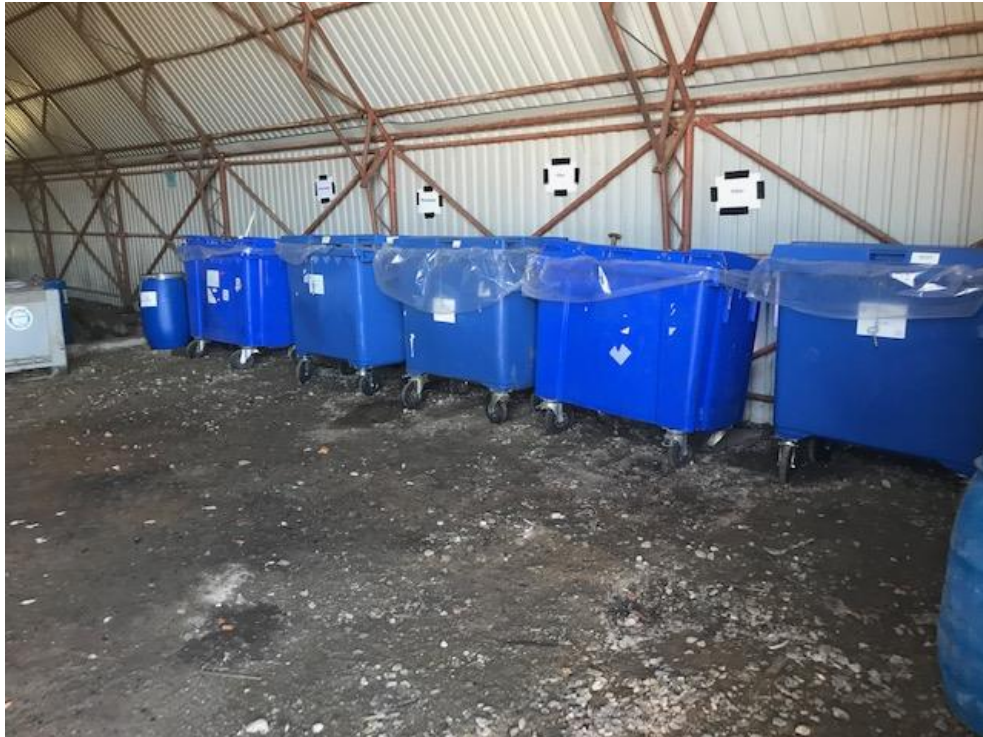
Billede 2. Oplag af affald i den blå telthal samt skiltning af containernes indhold.