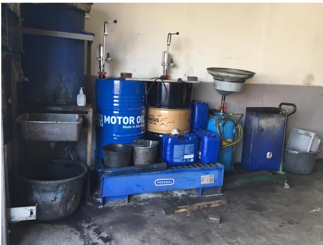
Figur 2: Oplag af kemikalier

Virksomheden foretager almindelige mekaniske bilreparationer. Der foregår ikke rudeskift. Der foregår kun mindre svejsearbejde, som eksempelvis svejsning af udstødning. Værkstedet er fordelt på to garager. Tilsynet omfattede kun den ene garage. Siden sidste tilsyn i 2016 er der etableret en opsamlingsrist under kemikalieopbevaringen, se figur 2.