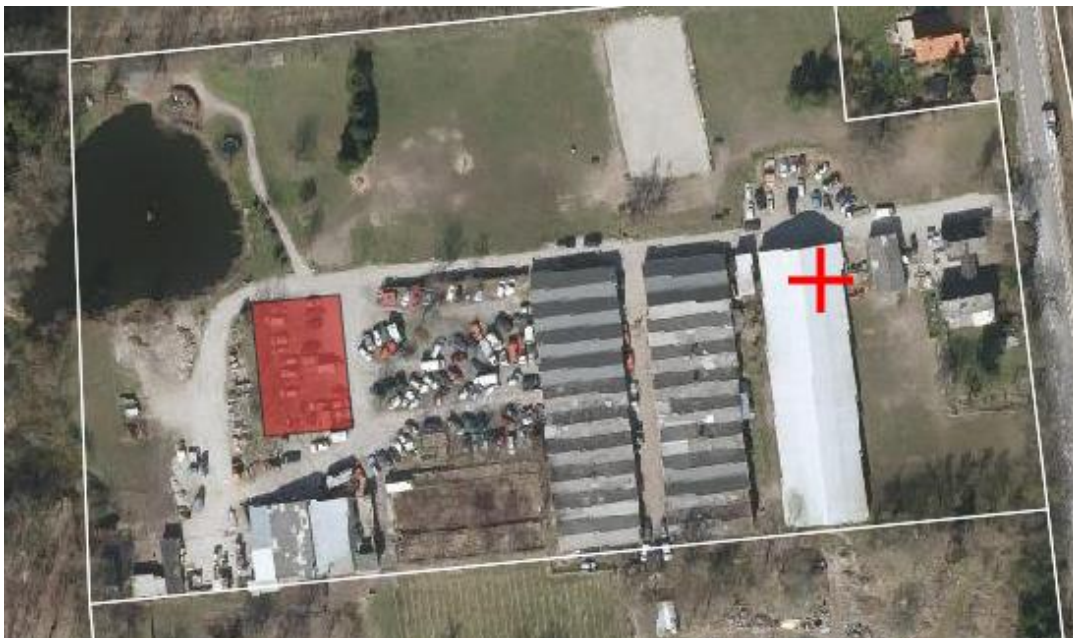
Figur 3: Angiver Jonstrupvej 117 -119, 2750 Ballerup, matr. nr. 31 Ballerup By, Ballerup. Hvid streg angiver matrikelafgrænsning. Rød markerig angiver V2-kortlagt areal.

En mindre del af ejendommen er kortlagt som forurenet, kaldet V2. Det kortlagte areal ligger på den vestlige del af ejendommen, se figur 3.