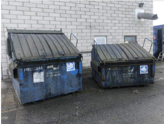
Billede 2. Containere til brændbart affald samt pap og papir

Det blev ved tilsynet nævnt, at virksomhedens skal være mere nøjagtige i deres sortering af brændbart affald når de kildesorterer deres affald. Herunder blev nævnt, at spraydåser bliver betragtet som farligt affald. Herudover skal papir og plastic ikke smides i beholdere til brændbart affald. Opbevaringen af den forskellige affaldsfraktioner var miljømæssigt forsvarlig, se billede 2-5 (billederne er fra tilsynet i 2021, men det var ved nuværende tilsyn ikke ændret på opbevaringen). Der var ikke nogen umiddelbar risiko for forurening af jord, grundvand eller recipient.