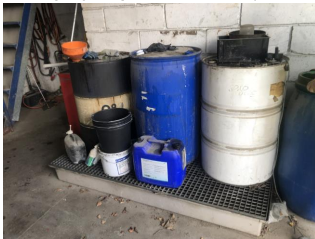
Billede 3. Opbevaring af spildolie med rist og opsamling