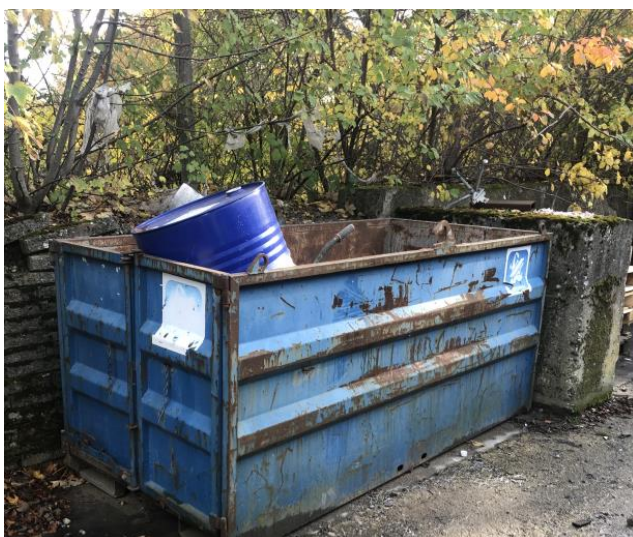
Billede 4. Affaldscontainer med metalaffald