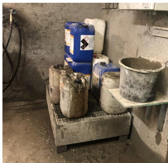
Billede 5. Oplag af kemikalieaffald på rist med spildebakke