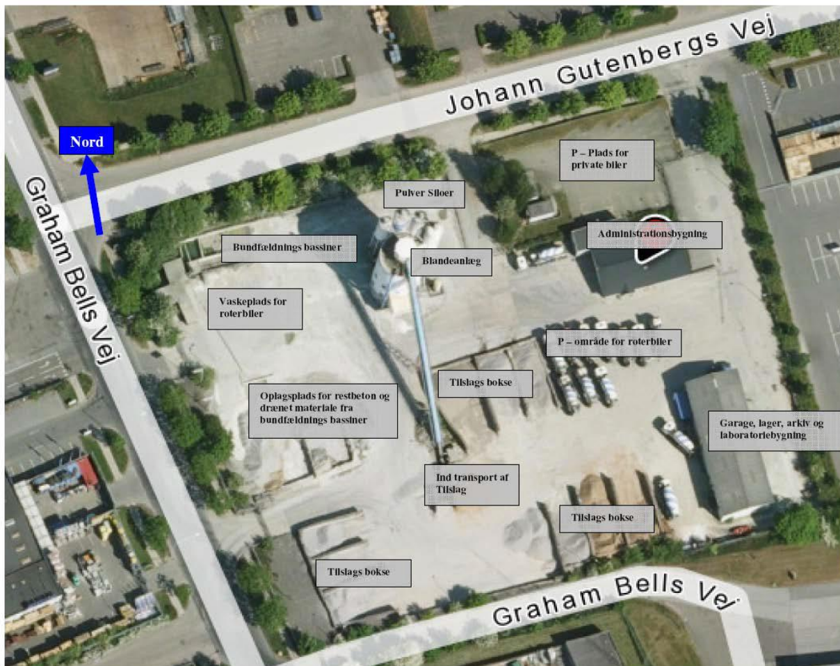
Billede 1. Oversigtskort over Unicon A/S areal.