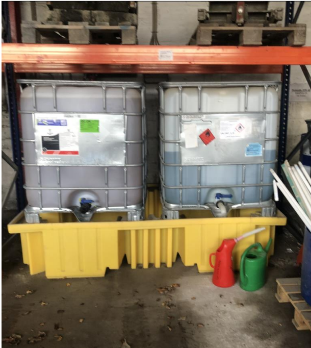
Billede 6. Råvarer placeret ovenpå spildbakke