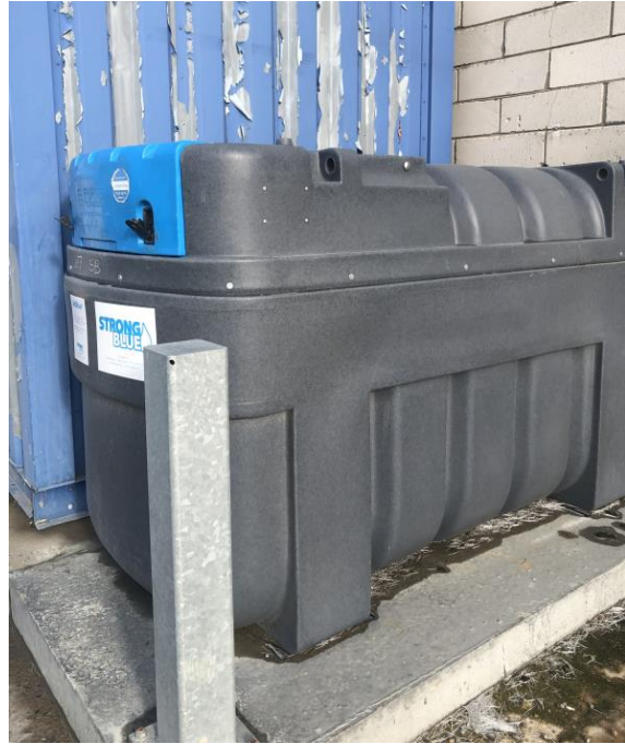
Billede 7. Adblue opbevaret i en dobbeltvægget tank på beton