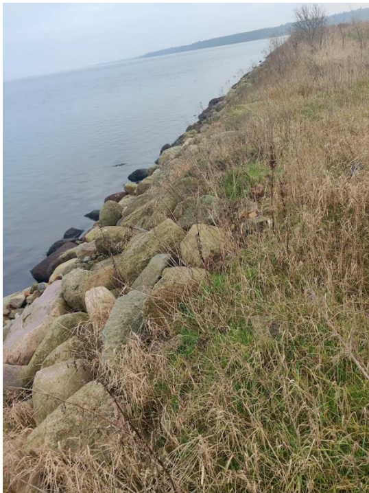
Figur 4 Udvendigt dige langs nordøstlige del af deponiet

Ved tilsynet blev digerne inspiceret. Ved tidligere tilsyn har det været påpeget, at der manglede afslutning med søsten på ydersiden af digerne. Dette er nu udbedret, se nedenstående fotos.