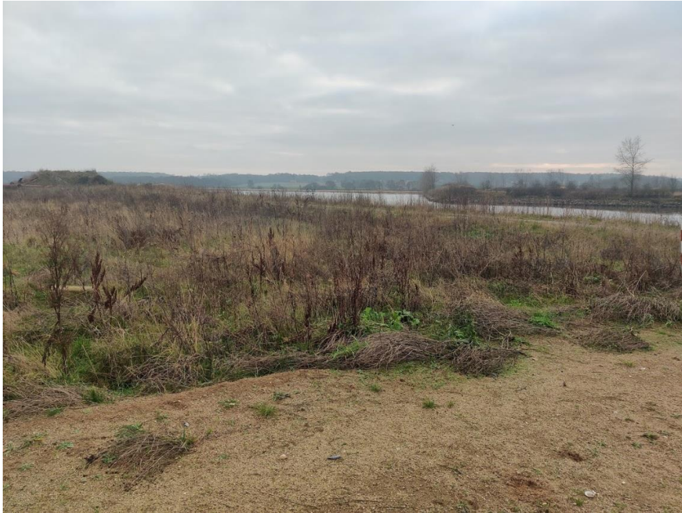
Figur 3 Overgang mellem slutafdækket og ikke slutafdækket del af etape 2.

Ved tilsynet blev digerne inspiceret. Ved tidligere tilsyn har det været påpeget, at der manglede afslutning med søsten på ydersiden af digerne. Dette er nu udbedret, se nedenstående fotos.