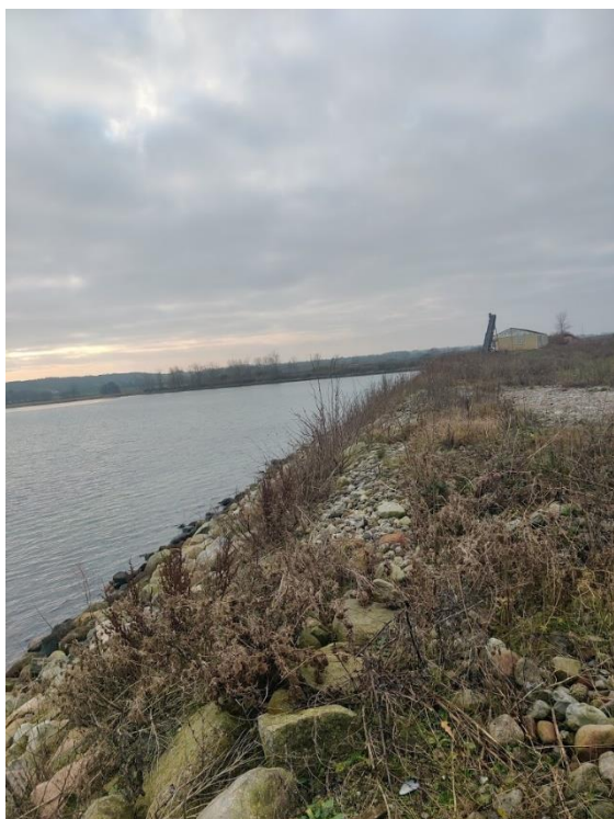
Figur 5 Udvendigt dige langs østlige del af deponiet