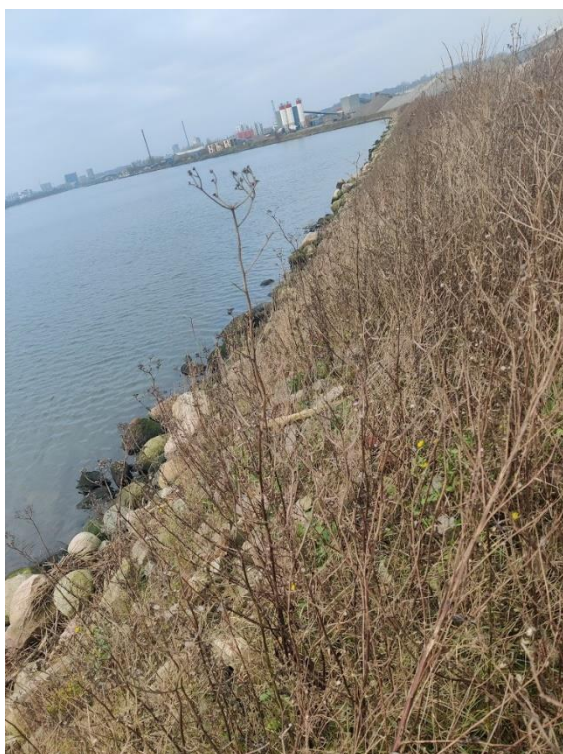
Figur 6 Udvendigt dige langs sydvestlige del af deponiet. Efter rundingen i diget ses etape 1 med betonvirksomhed og oplag af råstoffer.

På den yderste del af deponiet er der pt. oplagret en barak, se nedenstående foto. Barakken tilhører ikke havnen, men havnen har givet lov til at den midlertidigt opbevares. Miljøstyrelsen vurderer, at der ikke er nogen miljømæssig påvirkning fra dette, og har derfor indtil videre ikke indvendinger mod den oplagerede barak.