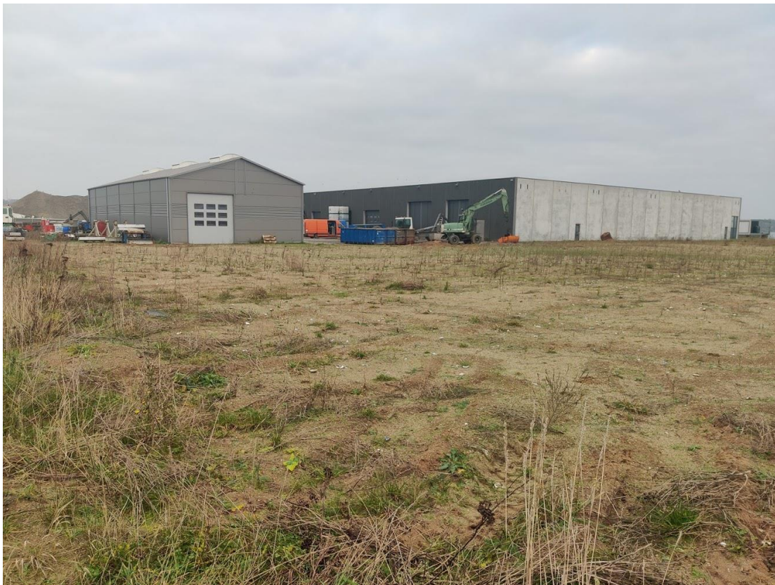
Figur 2 Slutafdækket område på etape 1. Wittrup Seafood i baggrunden.

For etape 2 har Miljøstyrelsen som beskrevet ovenfor i 2019 truffet afgørelse om, at et delområde af etappen er nedlukket. Det drejer sig om den del, hvor Wittrup Seafood er placeret samt et område lige øst herfor. Se foto nedenfor.