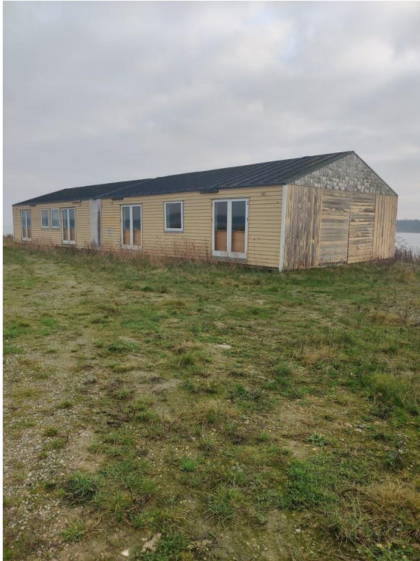
Figur 7 Barak midlertidigt opbevaret på den yderste del af etape 2.