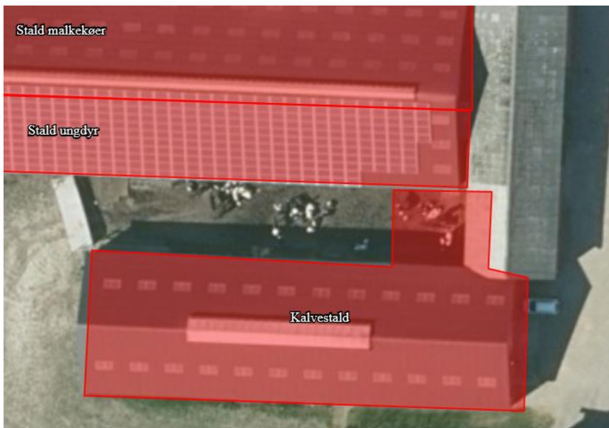
Figur 2: Udsnit af bygninger, hvor arealet til goldkøer og kælle-/sygebokse er rykket ind mellem de to staldbygninger. Området der rykkes er 9,5 x 11 m. Fra scenarieberegning. De røde områder er ikke målfaste.