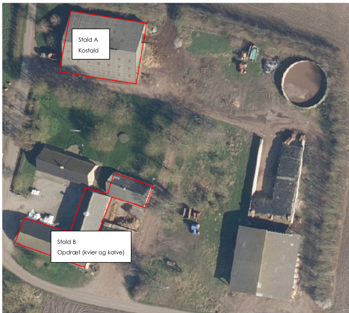
Figur 1. Oversigt over staldaf