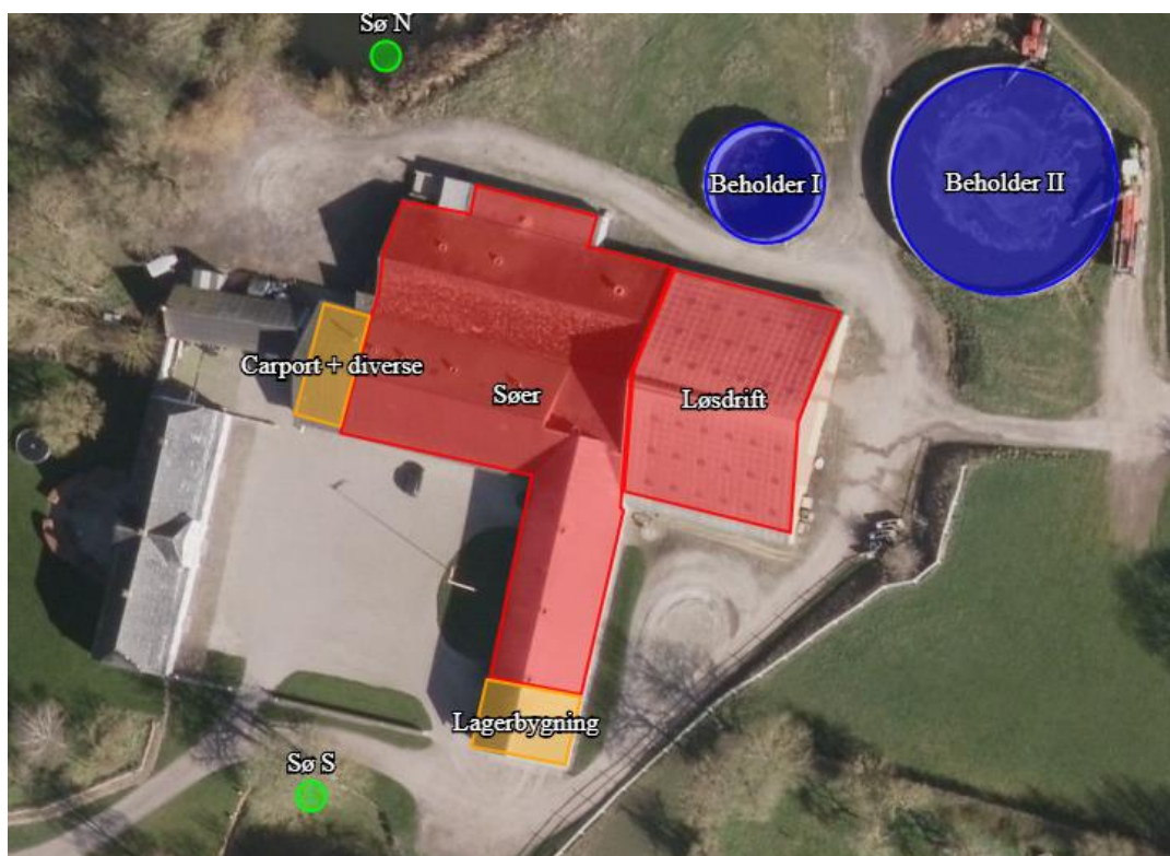
Figur 1: Oversigt over produktionsareal og dyrenes placering på Egerupvej 8, 5610 Assens.

Der er søgt om miljøtilladelse til det eksisterende produktionsareal.