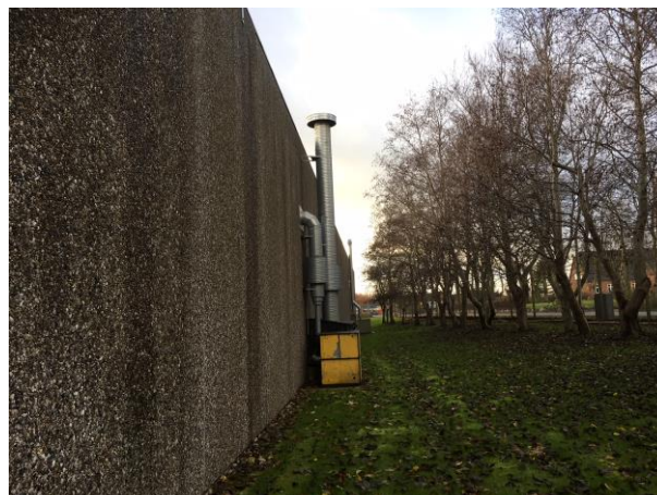
Billede af afkast

Afkasthøjde ved 2 - 4 svejsesteder er jf. Maskinværkstedsbekendtgørelsen BEK nr. 1734 af 21/12/2015 1 meter over tag. Det vurderes at være overholdt.