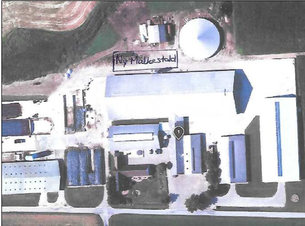
Kort 1: Placering af ny malkestald på Ravningvej 13.

Ole Sørensen, Ravningvej 13, 6760 Ribe har søgt om at bygge en ny malkestald. Malkestalden får en størrelse på ca. 920 m 2 og placeres nord for den eksisterende kostald. Placeringen fremgår af nedenstående kort.