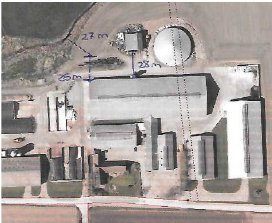
Kort 2: Afstand til skel