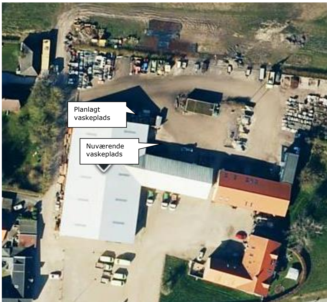
Luftfoto af virksomheden

Virksomheden ligger på matr. nr. 14a og 14c Årslev By, Sdr. Årslev, der i henhold til kommuneplanen er udlagt til landsbyområde. Områdets anvendelse er fastlagt til bolig- og erhvervsformål. Nærmeste boliger (Hestagervej 7 og 9) ligger i kort afstand vest for virksomhedens oplagsplads og planlagte vaskeplads – se nedenstående luftfoto.