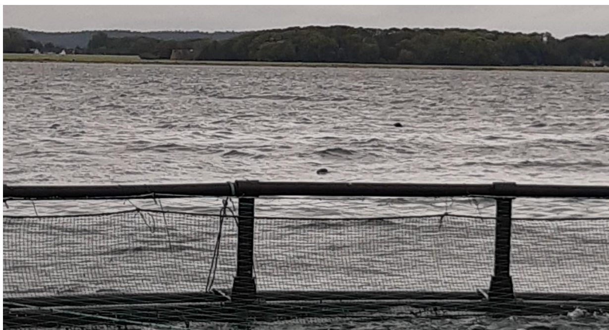
Figur 3 – To sæler omkring Hjarnø havbrugs bure. I alt blev der spottet fire individer på tilsynet.

Havbruget er plaget af sælangreb. På tilsynet blev der spottet omkring 4 sæler i nær afstand af burene, se figur 3. Samlet blev der fra Hjarnø og Hundshage havbrug i 2020 indsamlet ca. 47000 kg døde fisk og fiskehoveder som blev kørt til bioforgasning. For Hjarnø havbrug formodes mere end 19000 kg fisk ædt af sæler i 2020.