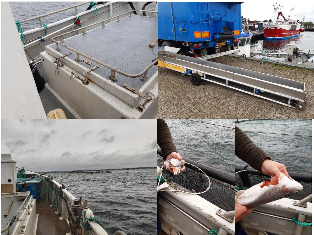
Figur 3 – Ø.tv: foderopbevaring på land, samt overførselsbånd fra land til båd, Ø.th: Foderbeholder på foderbåd, N.tv: foderkanon, samt beholder til døde fisk, N.th: fiskehoved og fisk med udsugede indvolde og rogn fra dødefanger.

På tilsynet demonstreredes fodring fra foderbåd, som foretages dagligt ved hjælp af en manuelt styret fodersprøjte. Fodringen tilpasses fiskenes ædelyst. Foderbåden kan laste op til 7 tons tørfoder i den lukkede beholder/silo midt i skibet, se figur 3, Ø.th. Foderbåden lastes fra container på havn (kapacitet: 33 tør tørfoder), se figur 3, Ø.tv.