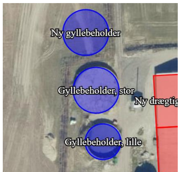
Figur 1: Ny placering af gyllebeholder

Figurene herunder illustrerer den nye placering af beholderen.