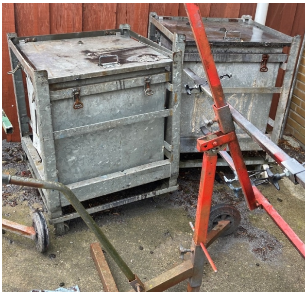
Opbevaring af farligt affald (maler- og lakrester) i lukket metalcontainer fra ABAS.