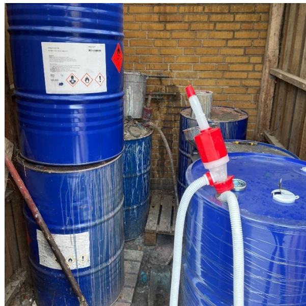
Opbevaring af spildfortynder i skur.