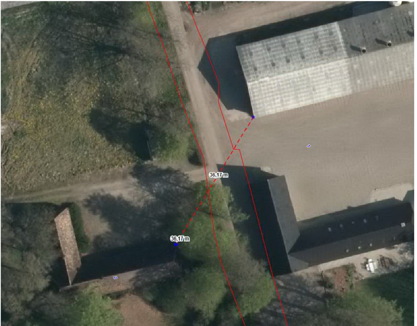
Figur 1: Afstand fra nabohus til lade der indrettes til stald er ca. 36 m. Afstandskravet i husdyrloven er 50 m.