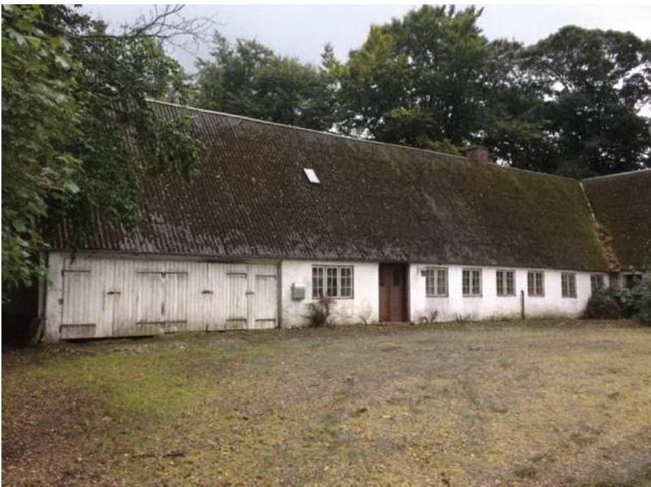
Figur 2: Husets ene ende er nu garage, ca. 6 m er derfor ikke beboelse.