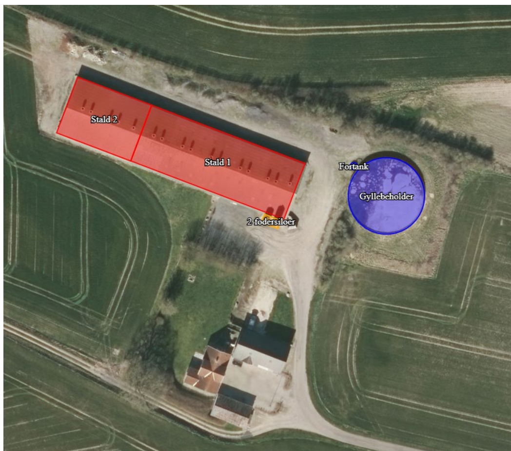
Figur 1: Oversigt over produktionsarealet på Tyllegård, Bogensevej 201, 5620 Glamsbjerg.

Der er søgt om husdyrtilladelse til det eksisterende produktionsareal på Tyllegård, Bogensevej 201, 5620 Glamsbjerg.