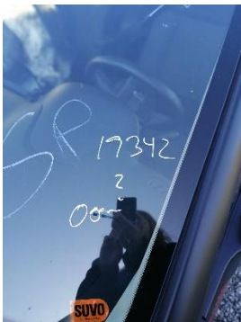
Billede 1. Bil mærket 19342, forsikringsbil- som ikke var drypfri.

En af forsikringsbilerne hørende til Sparta ApS var ikke drypfri. Der var væske under bilerne. Væsken lugtede af brændstof.