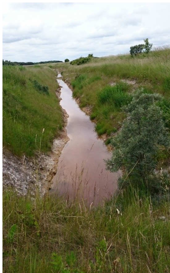
Billede 6: Området, hvor to søer bør ligge, hvoraf den ene er kortlagt. Billede 7: Den anden kortlagte sø. I forgrunden ses en tørlagt afvandingsgrøft. Billede 8: Omfangsgrøft langs den del af deponeringsområdet, som endnu ikke er ibrugtaget. Fotolokaliteten for hvert billede er angivet med tal på oversigtkortet først i tilsynsnotatet.