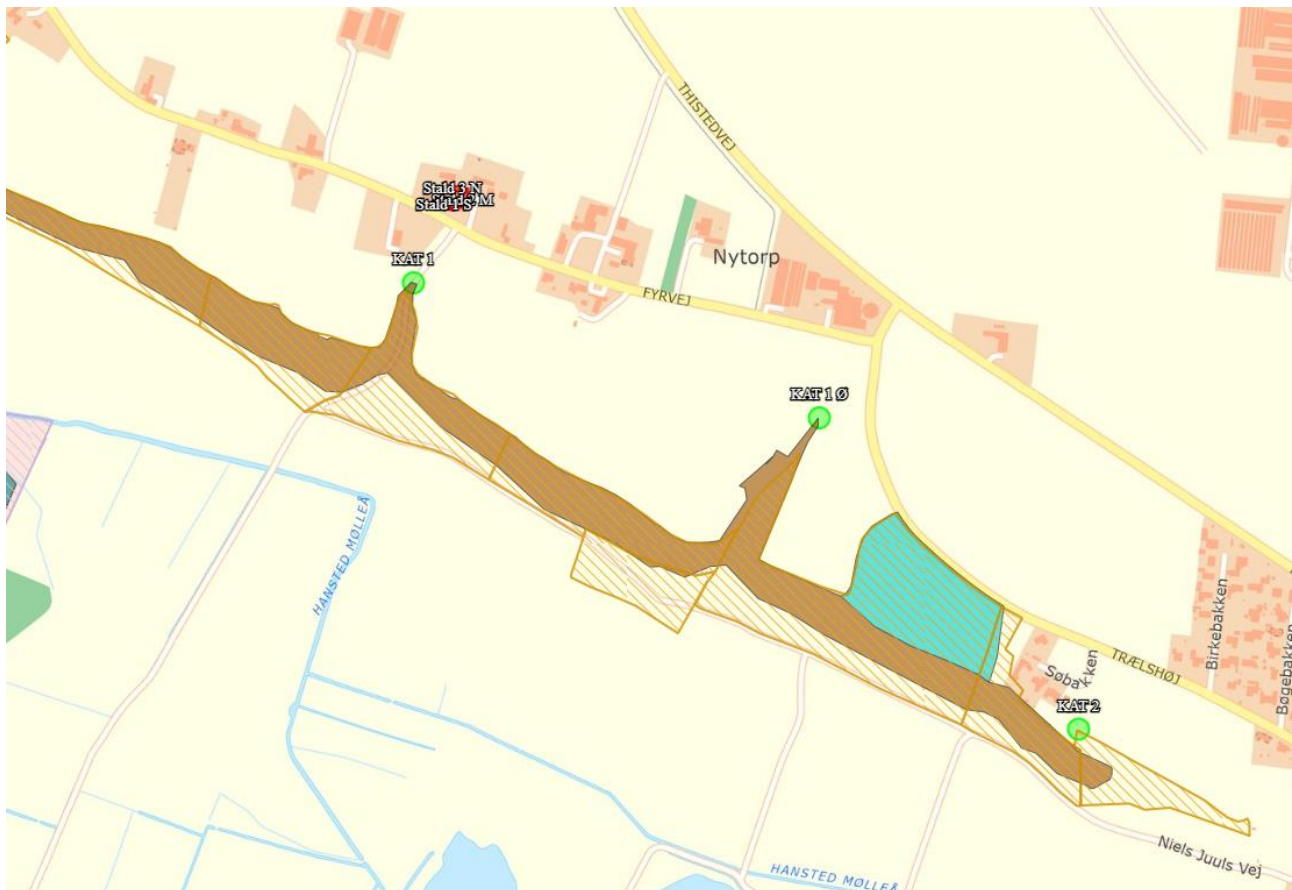
Oversigtskort over nærmeste kategori 1 og 2-natur