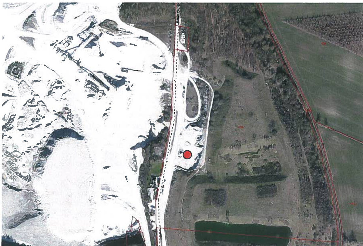
Figur 1: Oversigtskort