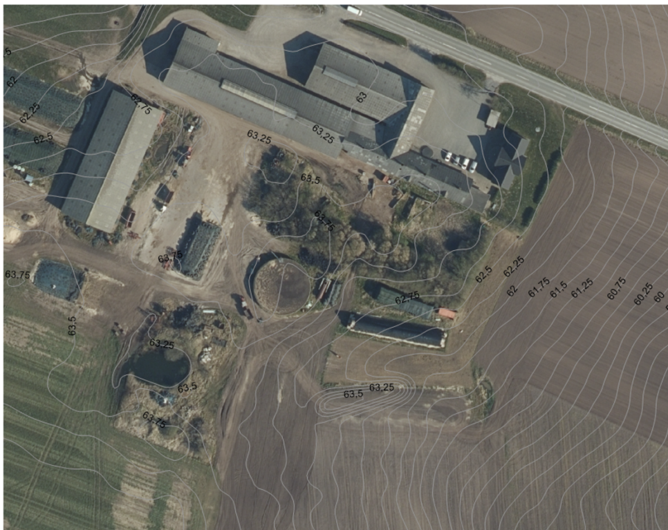
Figur 1. Højdekortet, et klip fra Rebild kommunes GIS kort.