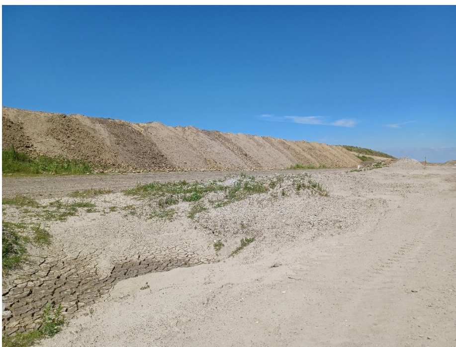
Mod nord langs støjvolden på GR og renjordsdepot

Slutafdækningen udføres med dokumenteret ren jord fra By & Havns renjordsdepot. Den rene slutafdækning placeres fra kote +2,0 og får en mægtighed på mellem 1,0 og ca. 10,0 m, idet der på og vest for GR-delarealet skal etableres en afskærende støjvold op til kote ca. +14,0.