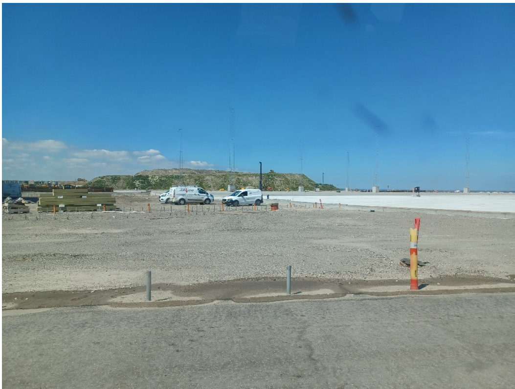
Fra østsiden af CT mod vest. Rør til afløb og mod nord betondæk ovenpå slutafdækning

CT planlægges fortsat at åbne i 2025. Området er fyldt op til kote 2,5 – 3 m. Det fremstår fladt og etablering af betondæk ovenpå skrider frem. Der er rammet i alt ca. 4200 pæle ned til understøttelse af betondæk.