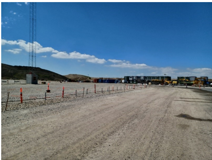
Mod sydvest, hvor opmarchområdet til containerterminal skal etableres