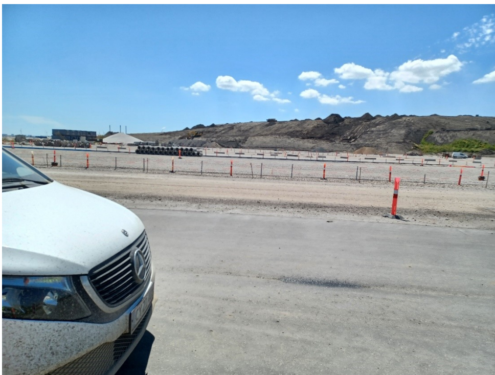
Nordhavnsdepotet fra ca. midt på vestsiden, set mod øst, med CT i forgrunden og det midlertidige oplag over kote 2,0 bagved til højre i billedet.