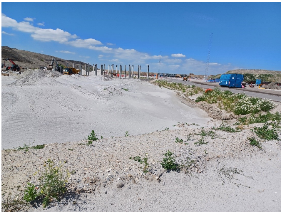
Mod vest. Betonpæle til converterbygning på Ladestrømsområdet

Følgende 3 foto er taget fra det nordøstlige hjørne af HUA.