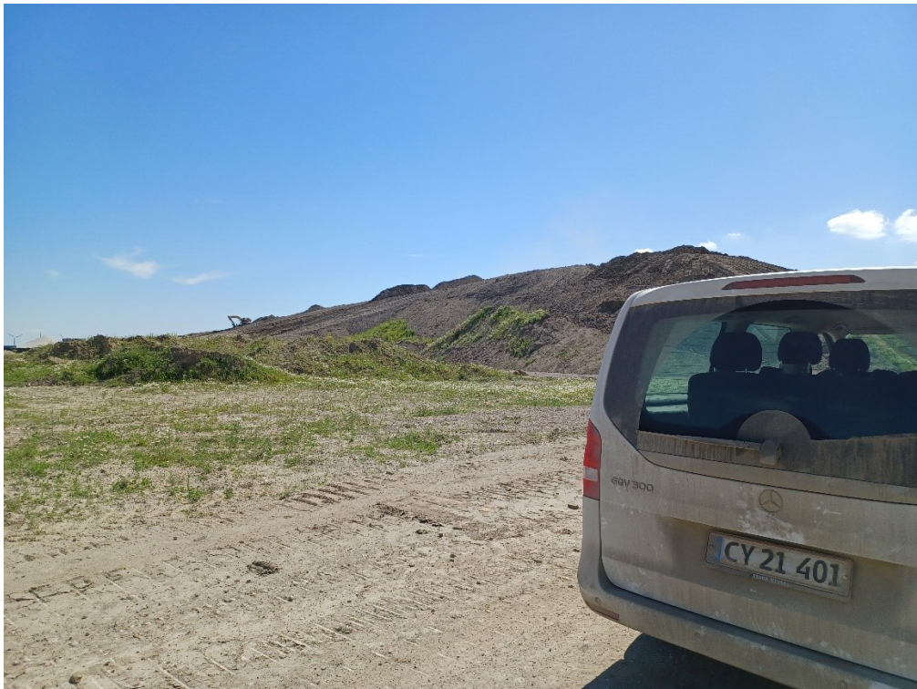
Mod sydøst og det midlertidige oplag over kote 2,0