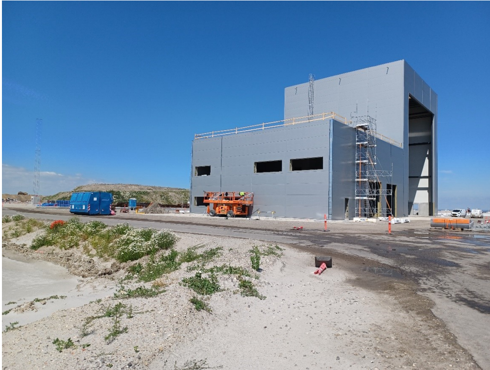
Mod nord. Værkstedbygningen inde på CT under opførelse