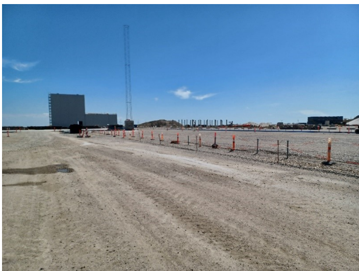
Mod sydøst, hvor opmarchområdet til containerterminal skal etableres