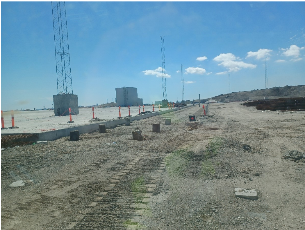
Fra nordsiden af CT mod syd. Ned langs vestkanten af betondækket