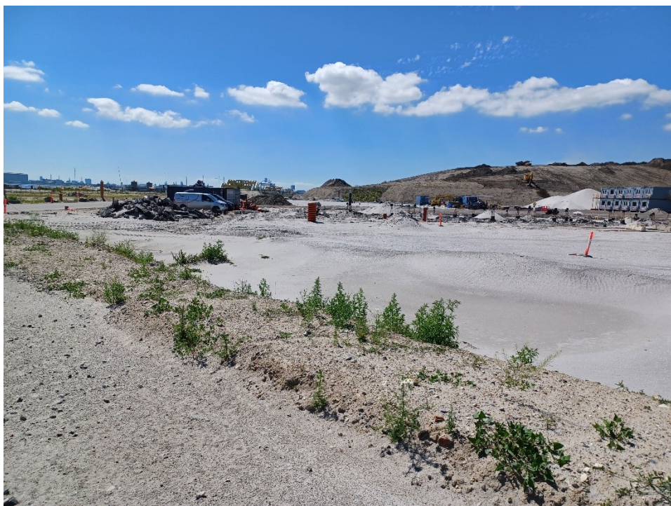
Mod syd. Den øst-vestgående bygning, der er forberedt til, er myndighedsbygningen