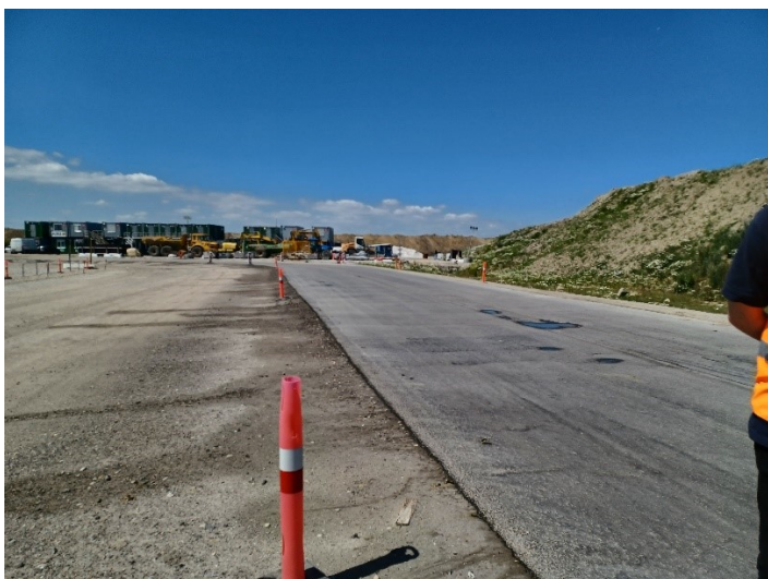
Mod vest. Slutafdækning af CT ses til venstre i billedet, syd for vejen