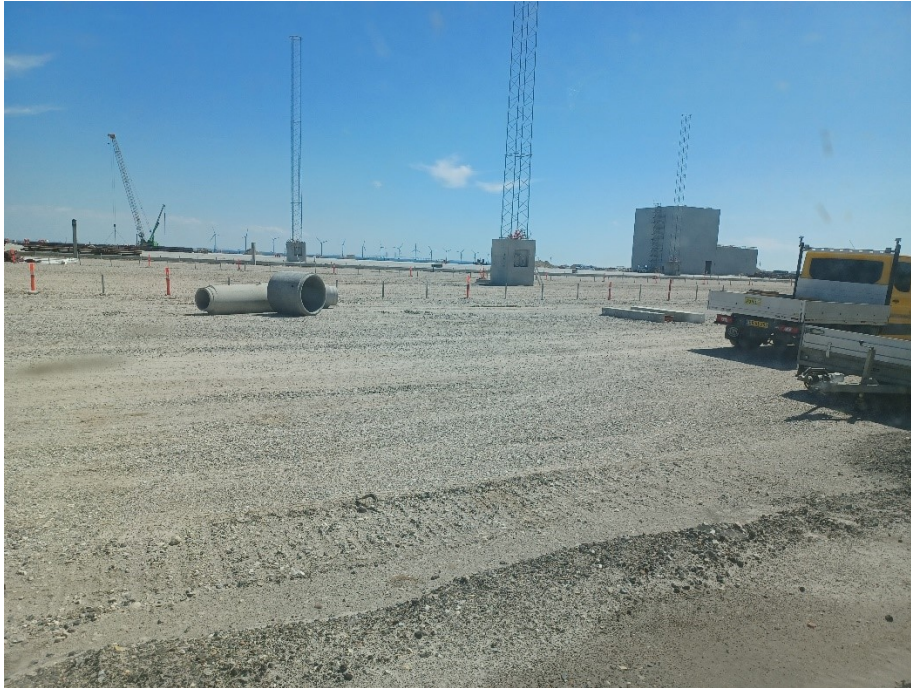
CT set fra nordvest.

De følgende 4 foto er taget ved vejknækket nogenlunde midt på vestsiden af CT.