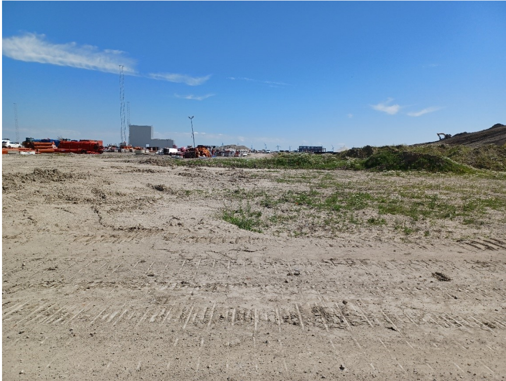
Mod sydøst og det midlertidige oplag over kote 2,0