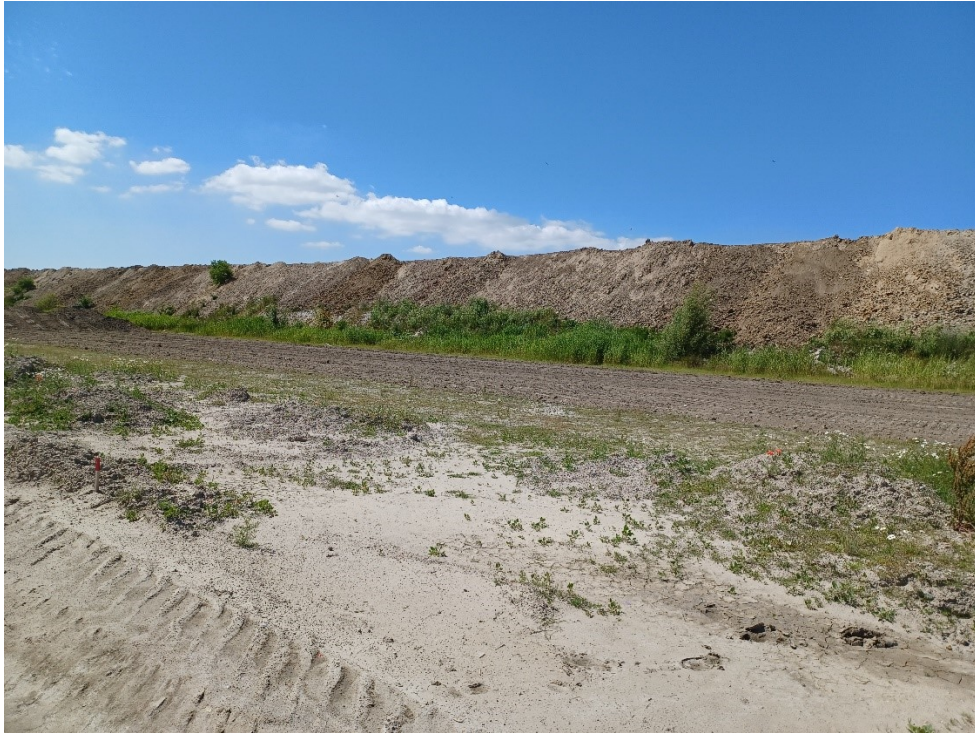
Mod syd langs støjvolden på GR og renjordsdepot