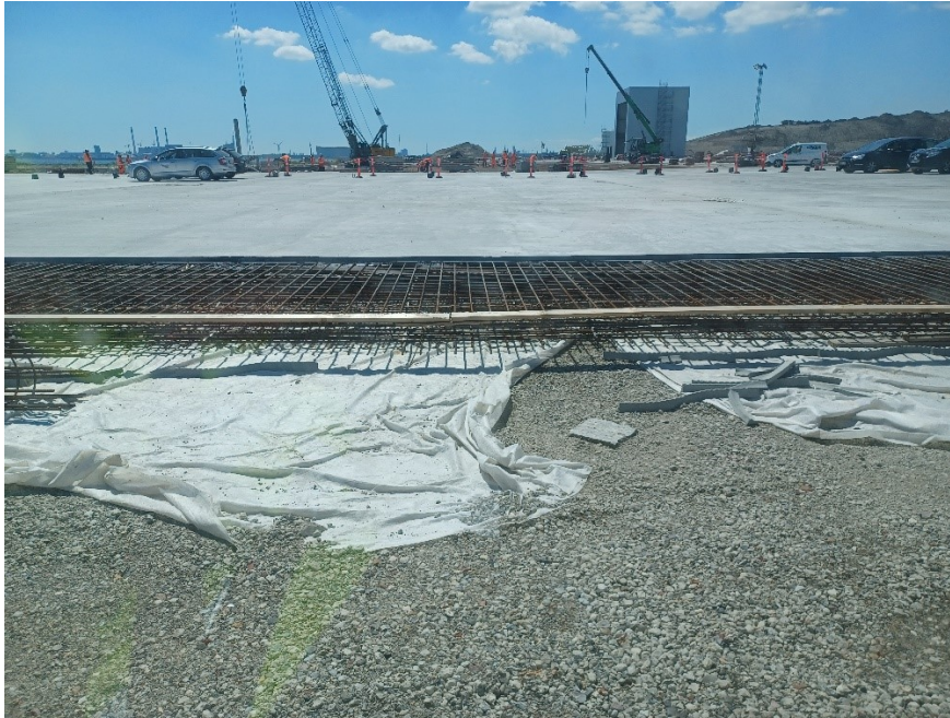
Fra nordsiden af CT mod syd. Klargøring til støbning af næste sektion af betondækket