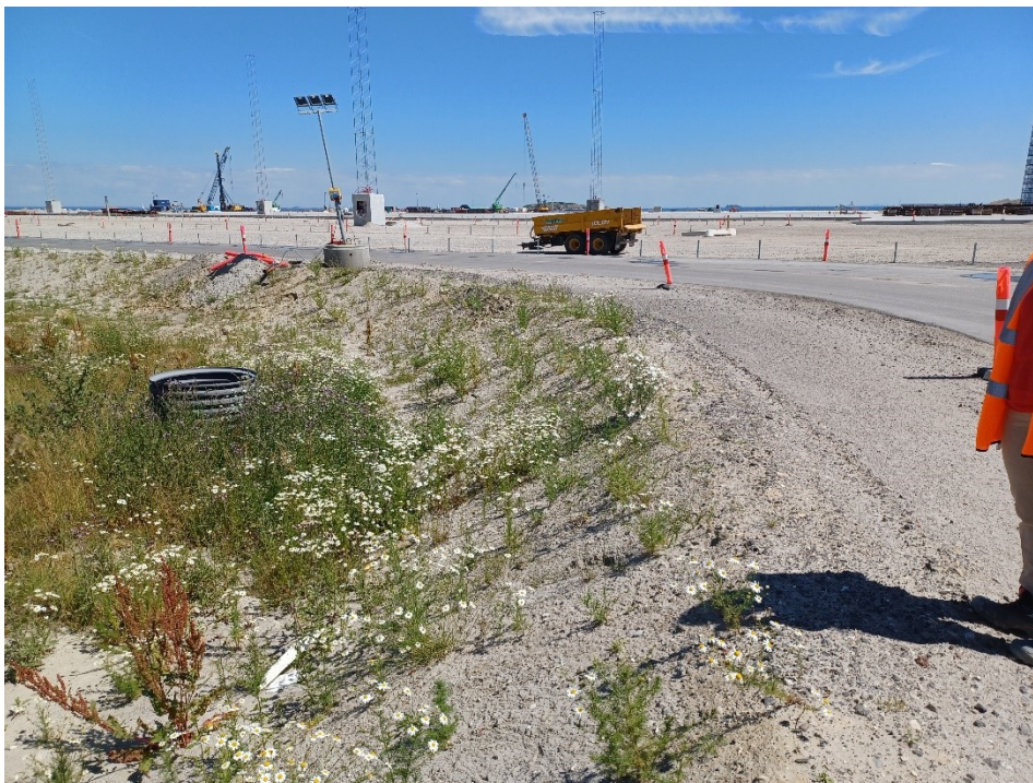
Mod øst. Bemærk at CT-området er ført længere op end området nærmest til venstre (nordvest for vejen langs den vestlige kant af CT)

De følgende 4 foto er taget ved vejknækket nogenlunde midt på vestsiden af CT.