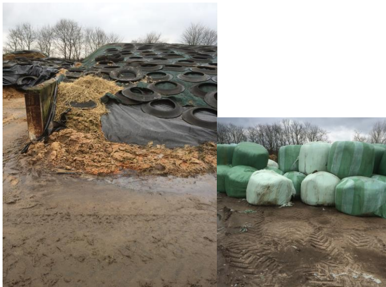
Billeder set fra plansiloens vestlige side samt oplag af wrapballe i marken.