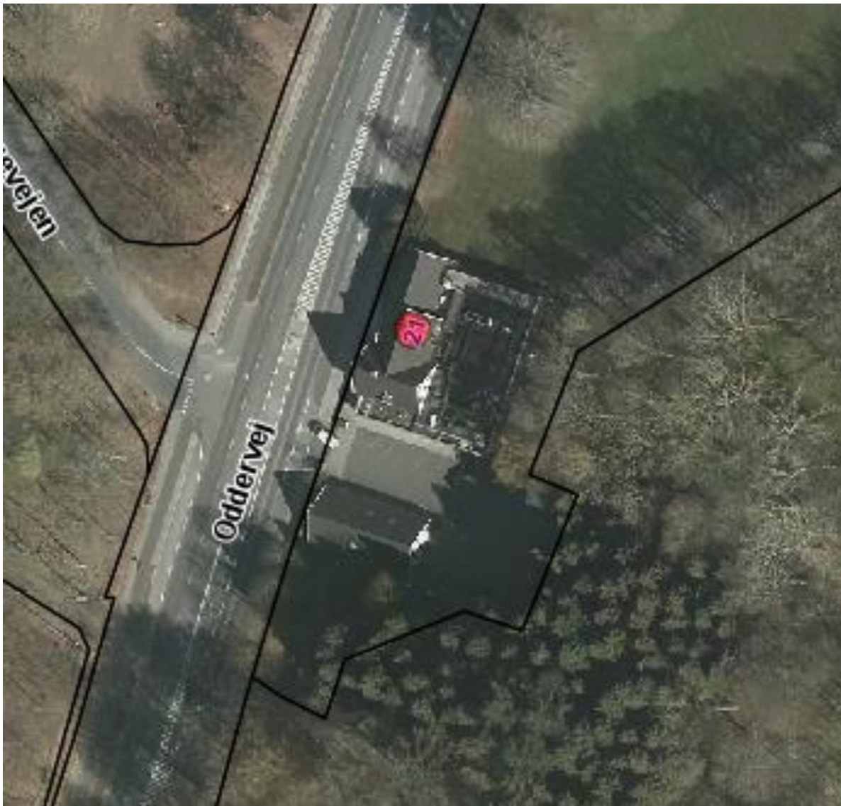
Luftfoto af skydebanen syd for Restaurant Frederikshøj med matrikelskel

Skydebanen ligger ud for et anneks syd for Restaurant Frederikshøj. Ejendommen ligger i område 11.00.01N.A., som er udlagt til jordbrugs- og naturformål. Mod nordøst ligger boligområdet 11.08.08.BO i en afstand af 160 meter. Banen er ikke synlig i omgivelserne udenfor indhegningen.