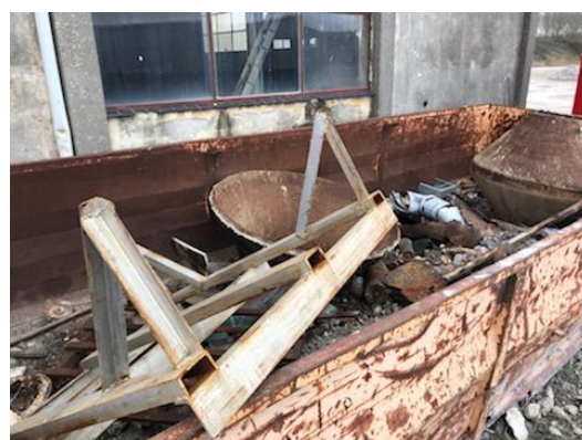
Opbevaring af jern- og metal sker i åben container

Begge dele kan tilgås fra Miljøstyrelsens hjemmeside, www.mst.dk . For at se data i ADS skal der bruges en digital signatur.