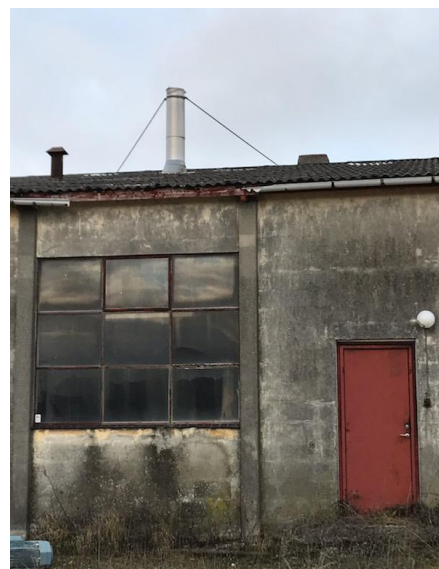
Afkast er ført over tag

Virksomheden opbevarer AdBlue og olie i til formålet egnede beholdere. Opbevaringen sker indendørs på tæt betonunderlag uden synlige revner og uden mulighed for spild til kloak eller udendørs arealer.