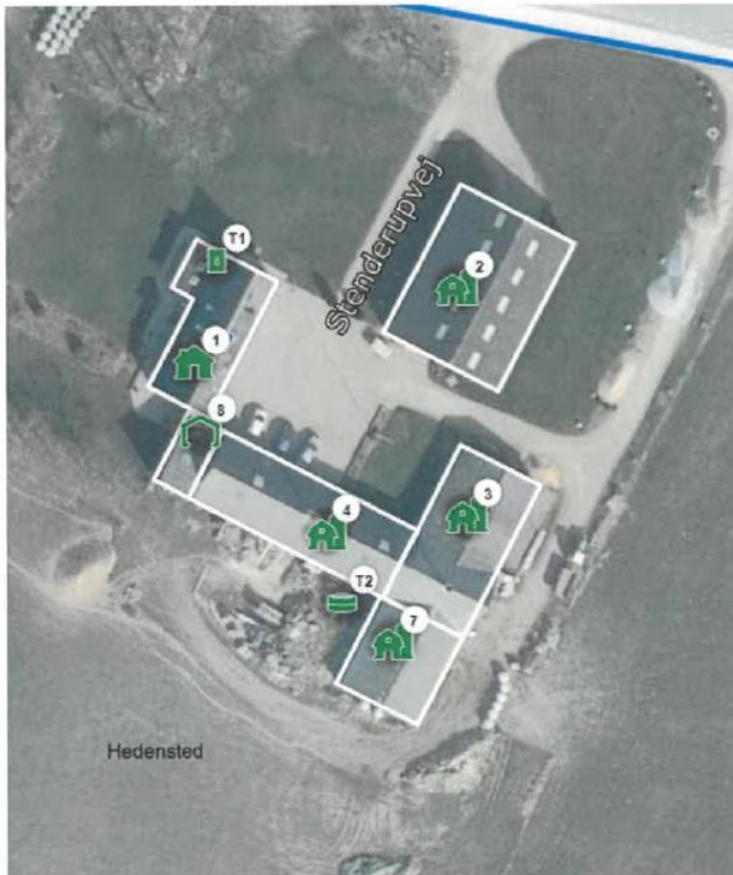
Figur 1 Kort over staldbygninger jf. BBR. Produktionsareal er i bygning 3 og 7.