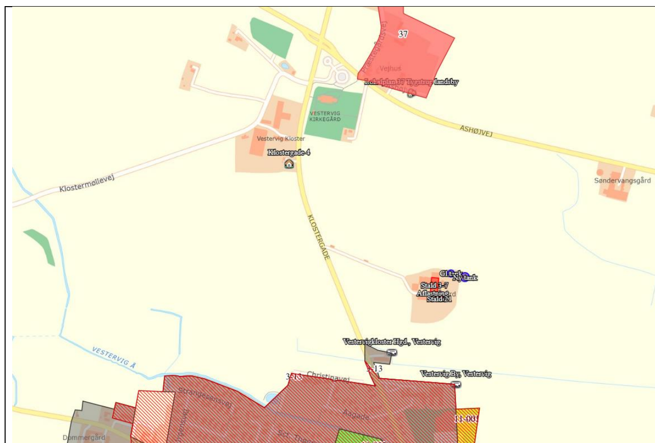
Oversigtskort over nærmeste enkeltbolig, samlet bebyggelse og byzone