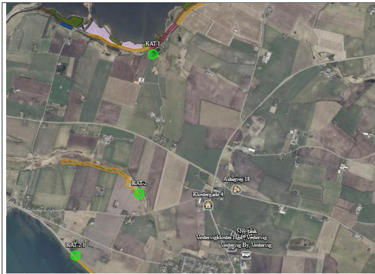
Oversigtskort over nærmeste kategori 1 og 2-natur