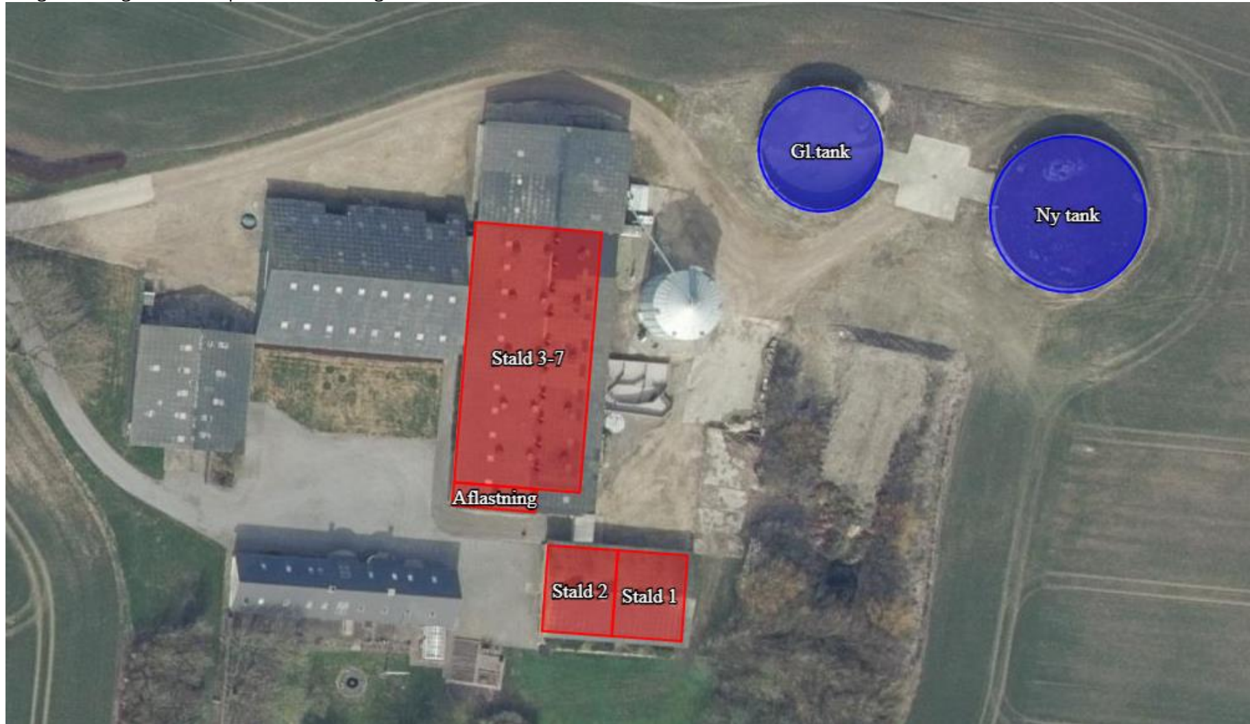
Bilag 2 Oversigtskort over produktionsanlæg