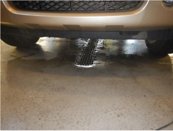
11. Afløb fra lokale ved billede 9.