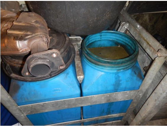
13. Bremsevæske og frostvæske.