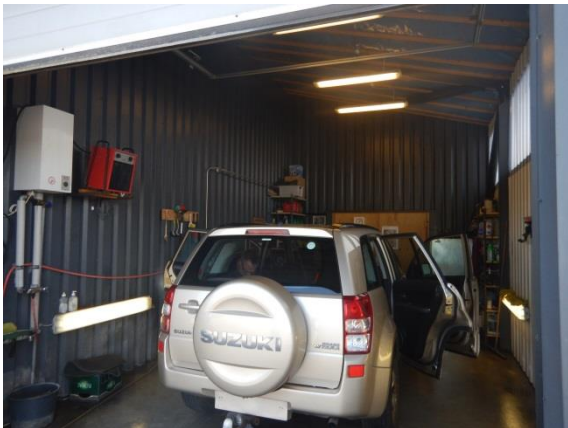
9. Lokale til vask af biler. Spildolietank i baggrunden.