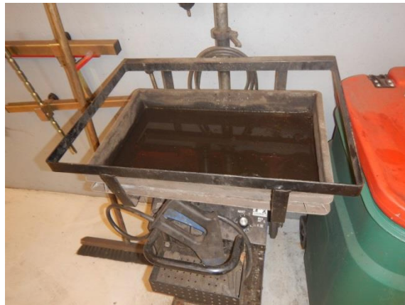
2. Til væske fra bremserens – overdel midlertidigt til reparation.