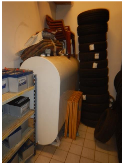
4. 1.200 l olietank med fyringsolie.