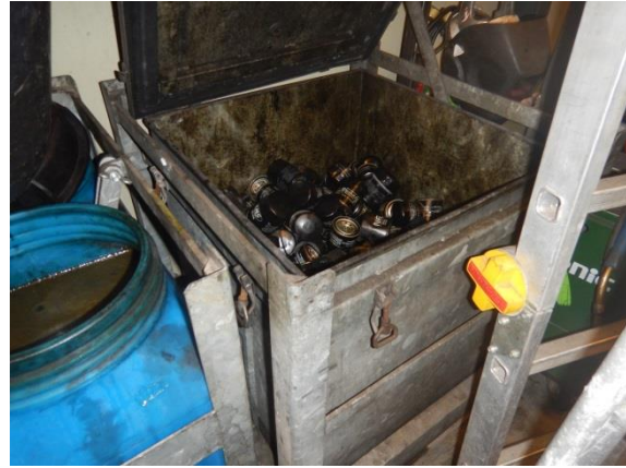
12. Brugte oliefiltre.