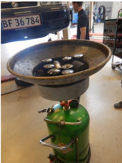
3. Afdrypning af oliefiltre.