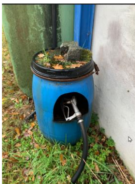
Foto af beholder til opbevaring af påfyldningstudsens, så evt. spild opsamles. Der er en spand inde i beholderen som kan tømmes.

Under tilsynet fortalte du at forbruget af dieselolie ikke er stort da der kun bruges brændstof til varevogn og en gammel traktor. Der er ikke tegn på spild af dieselolie og du er opmærksom på at påfyldningsslangen ikke må dryppe, se nedenstående foto.