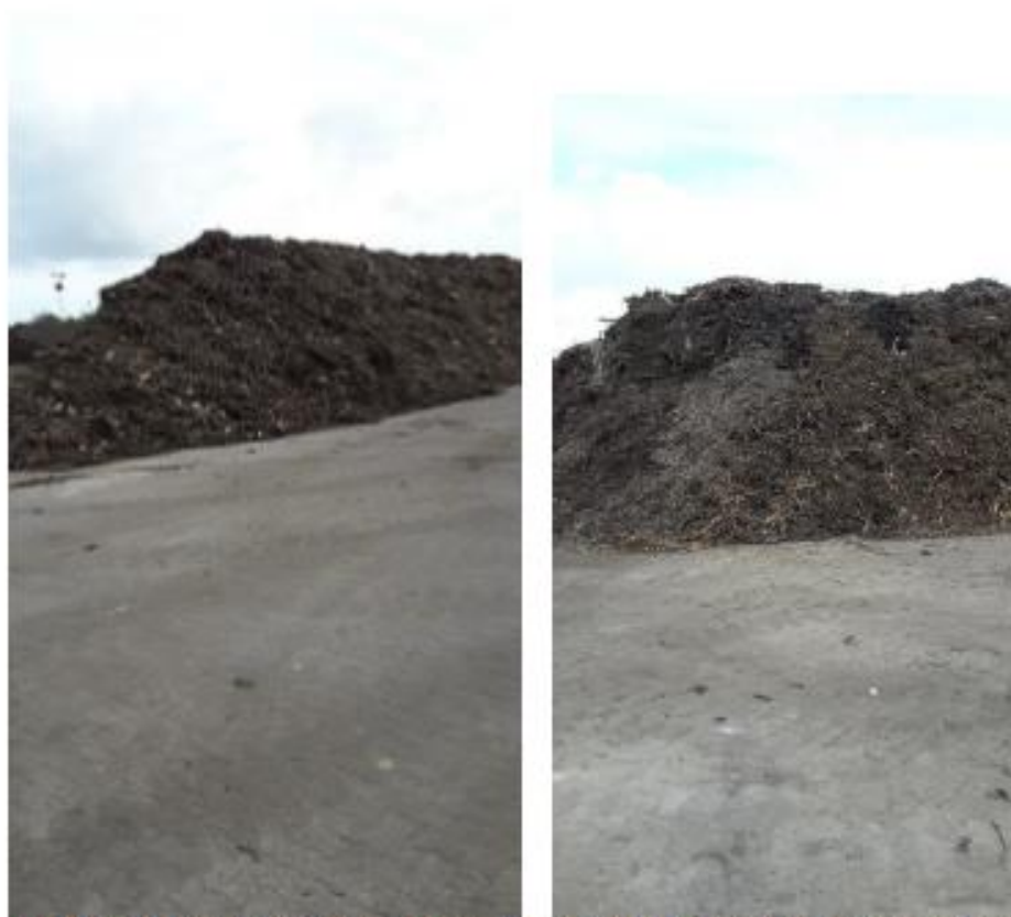
Figur 1 tv. Mile med landbrugskompost. Th. mile med flis, som kan sælges som brændsel. Flisen er sorteret fra det neddelte have og parkaffald.

På selve tilsynsdagen var der et enkelt afløb, som var stoppet til, hvorfor der var opstået en større vandansamling på pladsen for have og parkaffaldet. Der var allerede et arbejde i gang med at få afløbet fra pladsen rensat, så vandet kunne ledes bort.